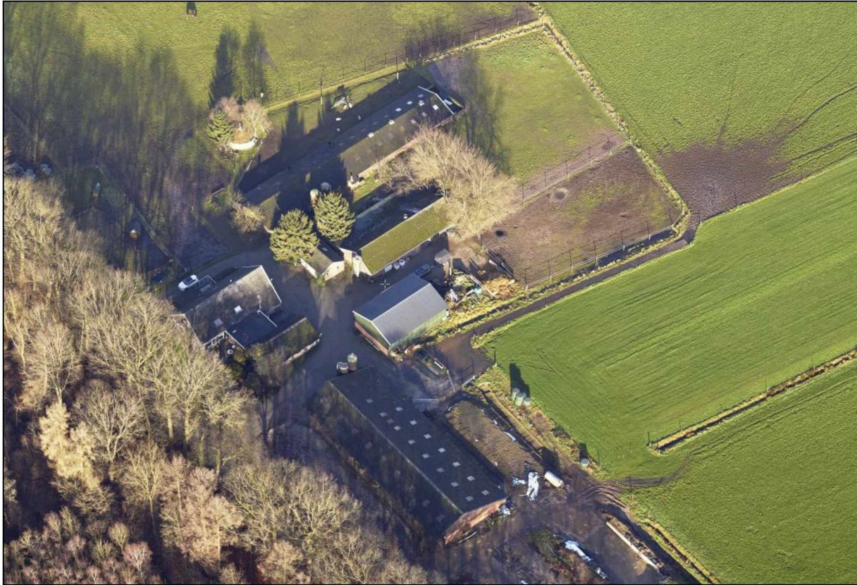
Figuur: Luchtfoto van de initiatieflocatie