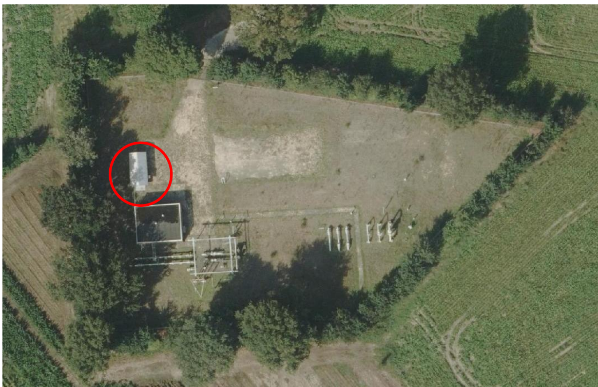
Figuur 1: Voorbeeld locatie M&R met daarop de locatie van de opslagtank odorant rood omcirkeld

De ligging van de bestaande odorant opslagtank is eerder gemeld bij het bevoegd gezag. De ligging (coördinaten) van de milieubelastende activiteit is in het DSO aangegeven.