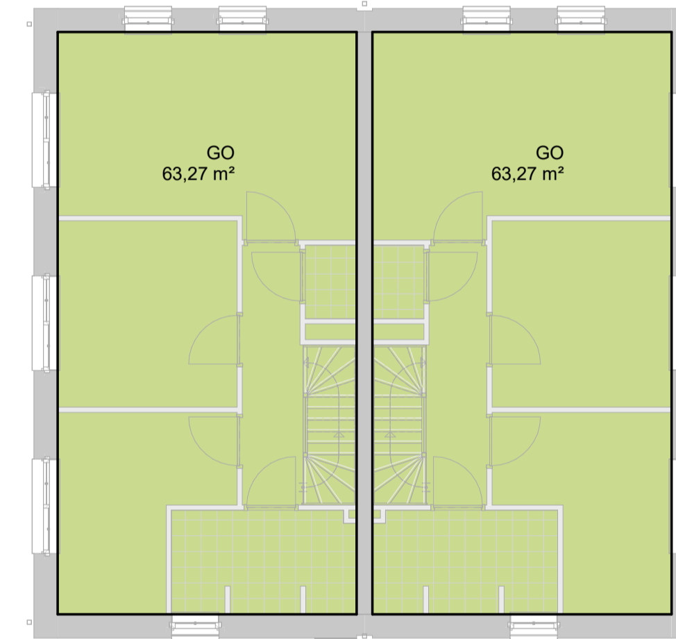
GO eerste verdieping