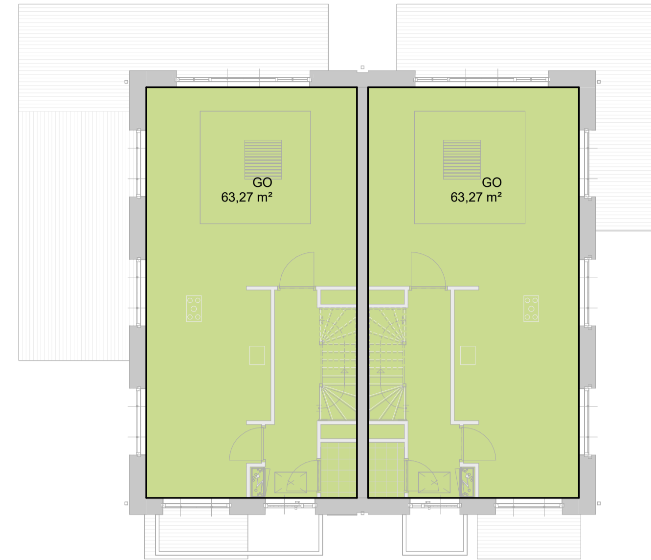
GO begane grond