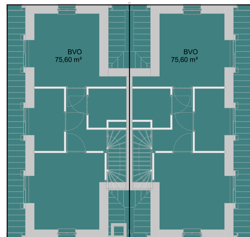
BVO tweede verdieping