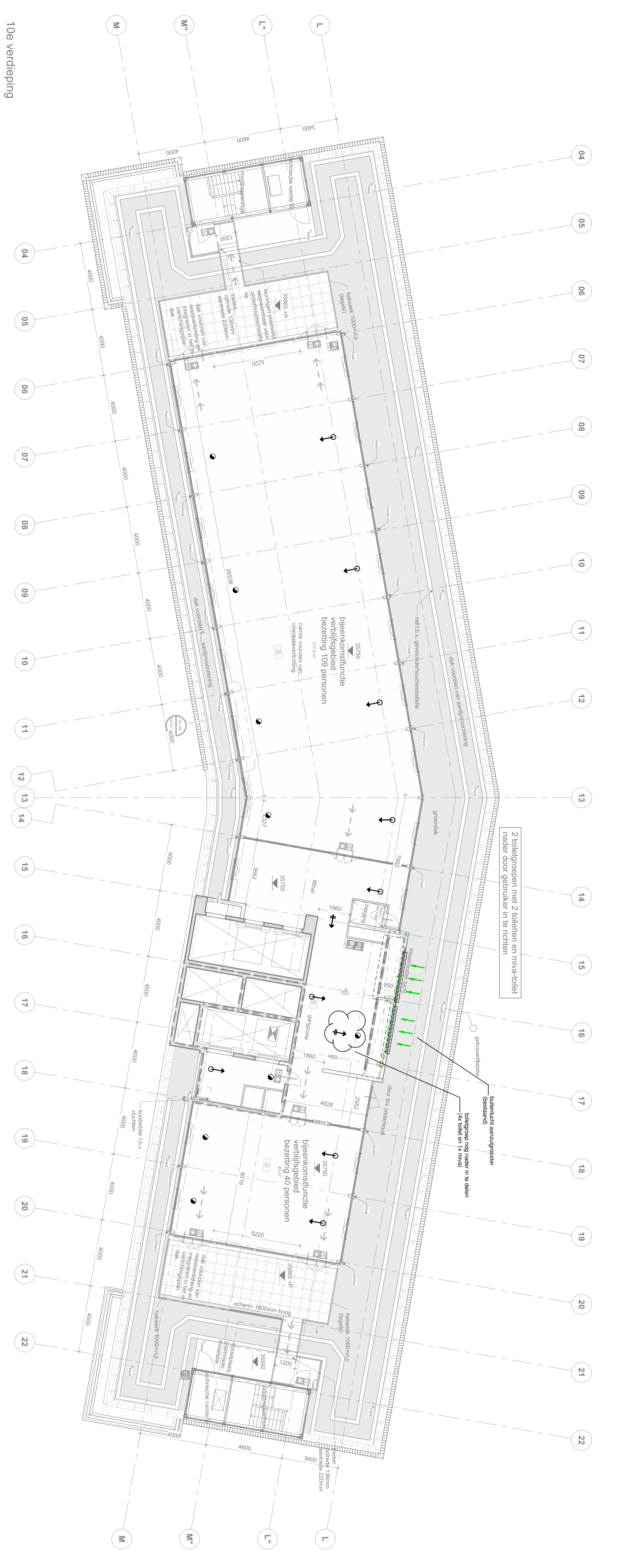
10e verdieping 1 : 100