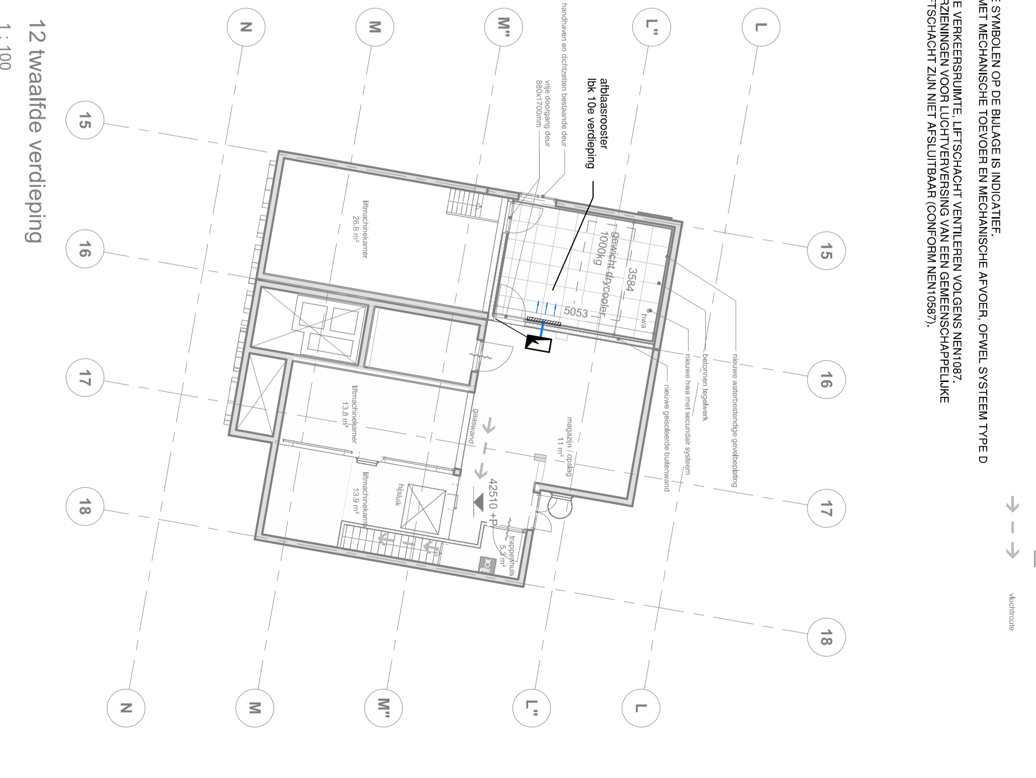
12e verdieping 1 : 100