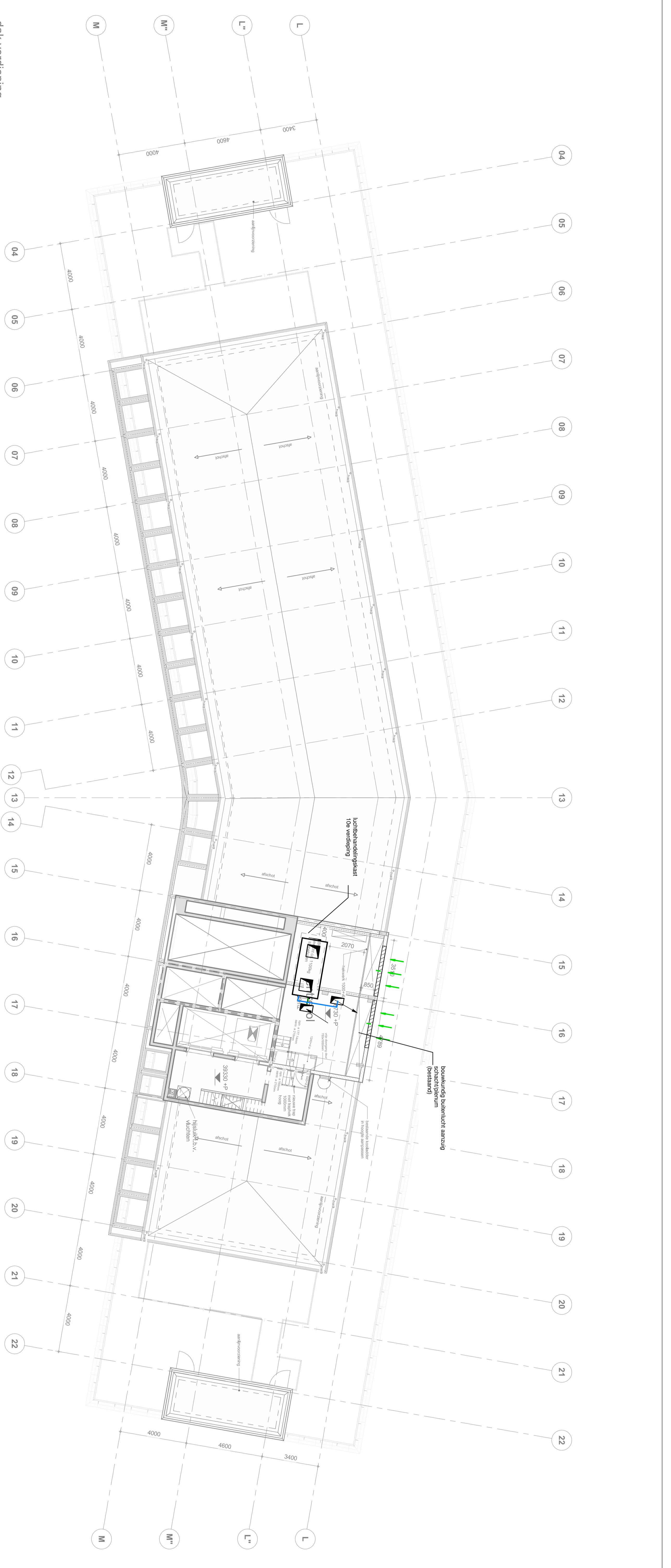
10e verdieping 1 : 100