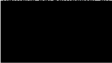
H.P.T. Verberk regisseur omgevingsvergunningen

Met vriendelijke groet, namens burgemeester en wethouders van Deurne