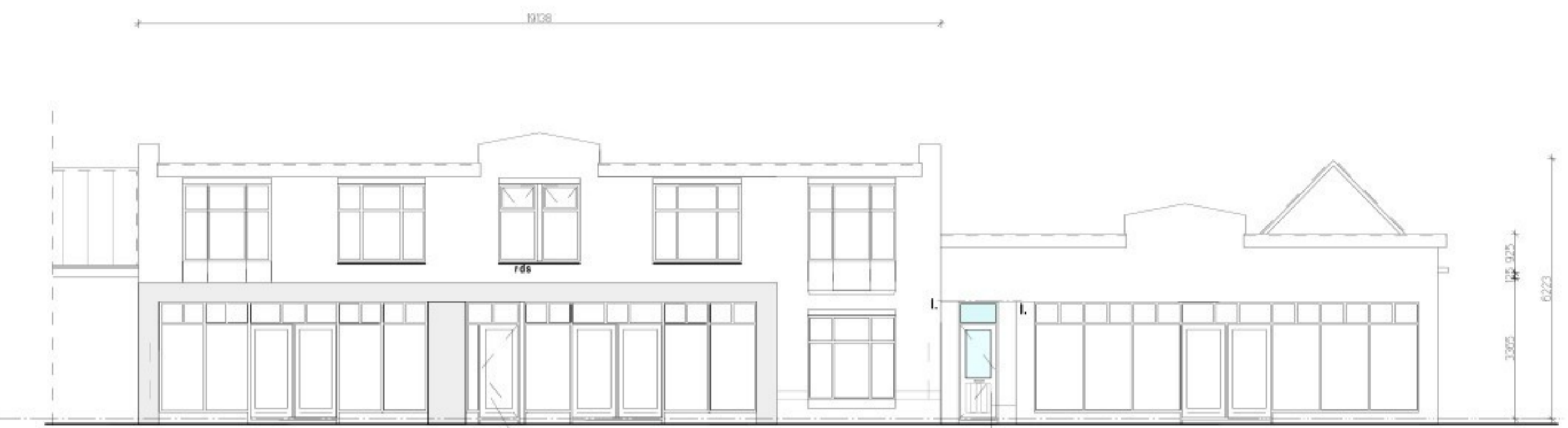
gewijzigde voorgevel - voorpoort