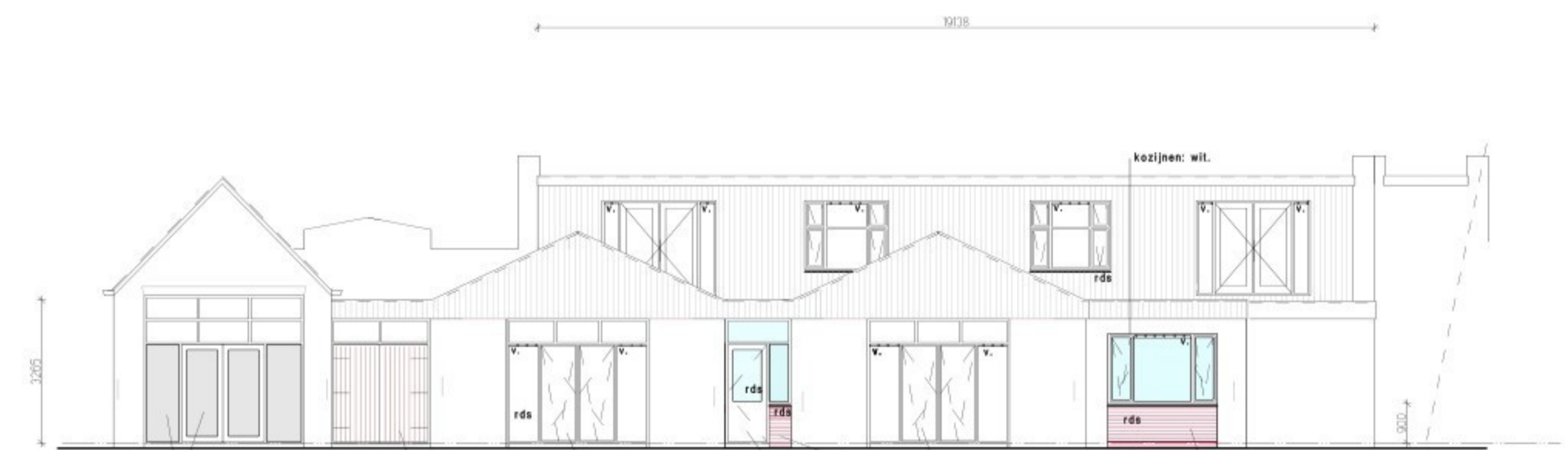
gewijzigde achtergevel - Groenestraat

Voor begane grond pand zie tek.: 20251008.2 Voor maatvoering woningen zie tek.: 20251008.4