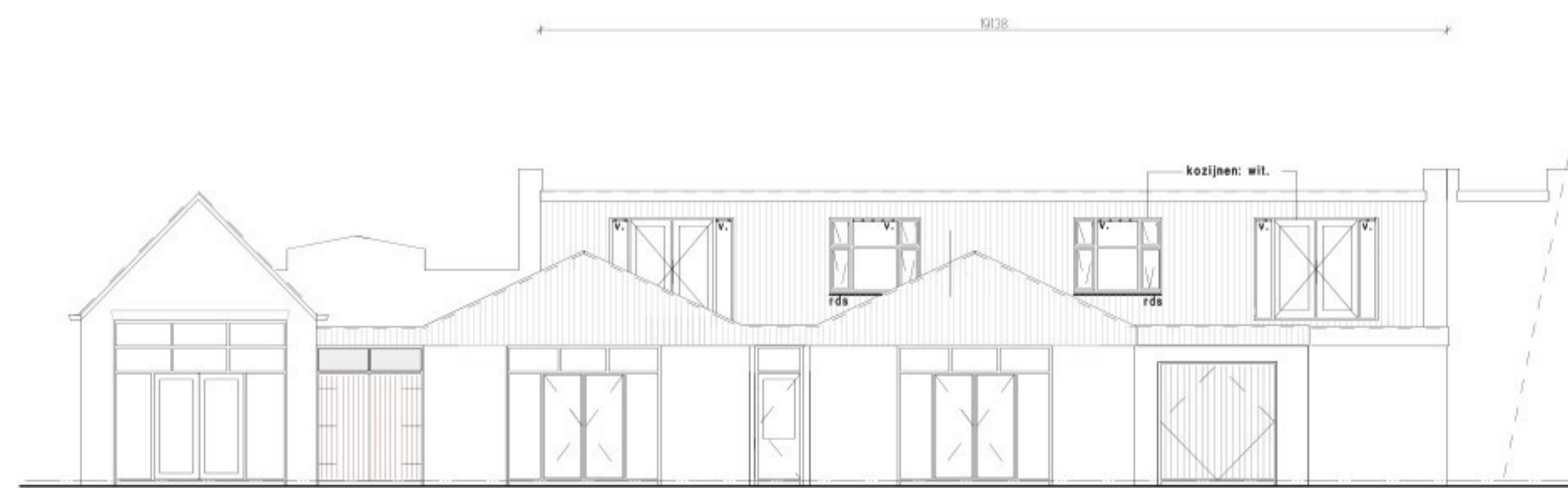
bestaande achtergevel - Groenestraat