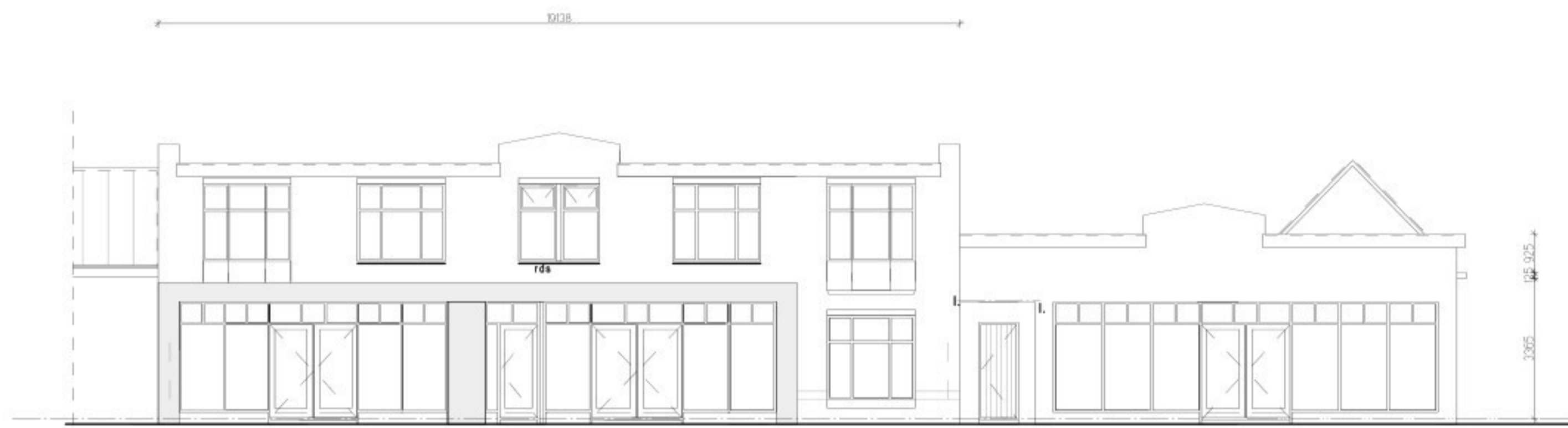
bestaande voorgevel - voorpoort