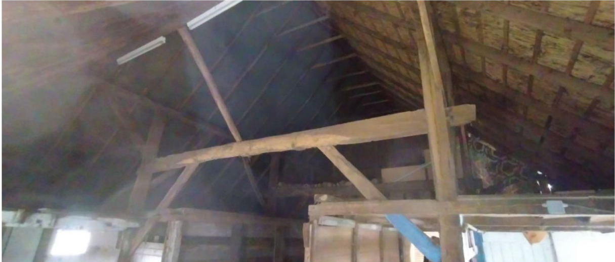
Gebinten handhaven; plaatselijk herstellen. Dakvlak links en achter zijn uitgevoerd als schroefdak. Dakvlak rechts eveneens uitvoeren als schroefdak.