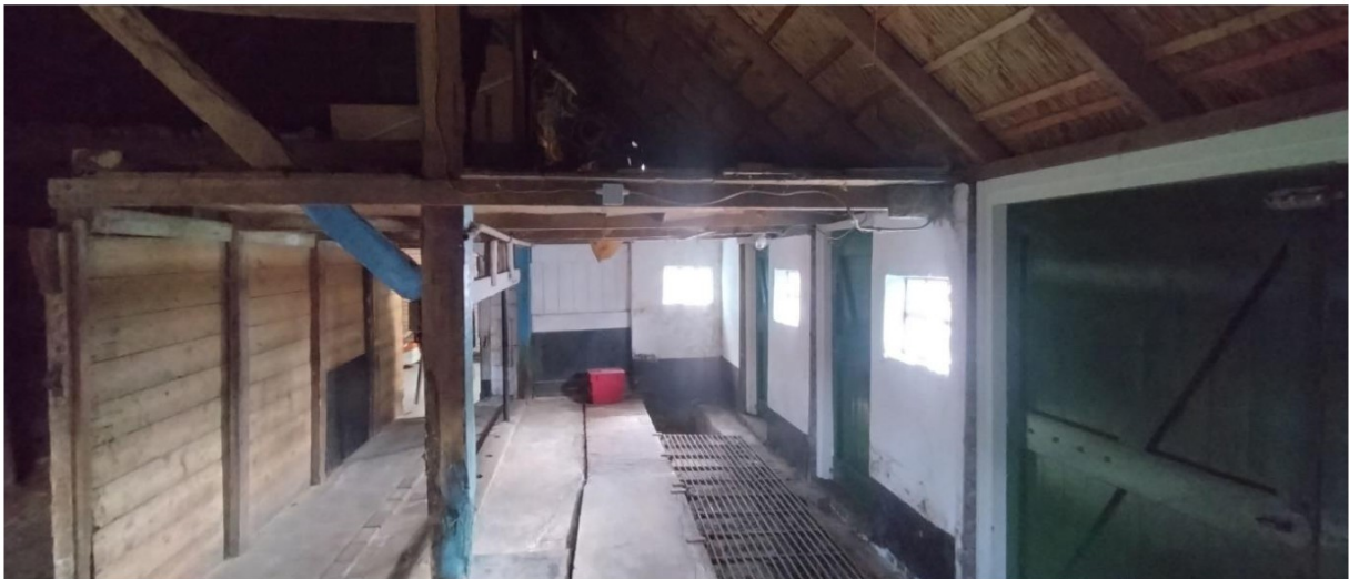
Nieuwe inrichting achterhuis volgens tekening, gebinten handhaven. Let op! Koppeling horizontaalkracht door hildes. Vloeren vervangen volgens advies Monumentenwacht; nieuwe inbouw volgens i [REDACTED]