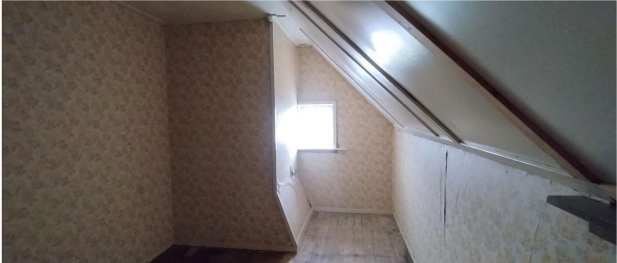
Inrichting verdieping boven voorhuis wordt veranderd zo als op tekening aangegeven. Schoorsteenkanaal verwijderen.