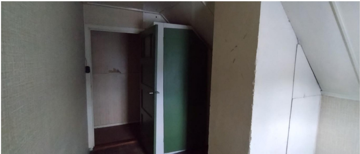
Inrichting verdieping boven voorhuis wordt veranderd zo als op tekening aangegeven. Schoorsteenkanaal verwijderen.