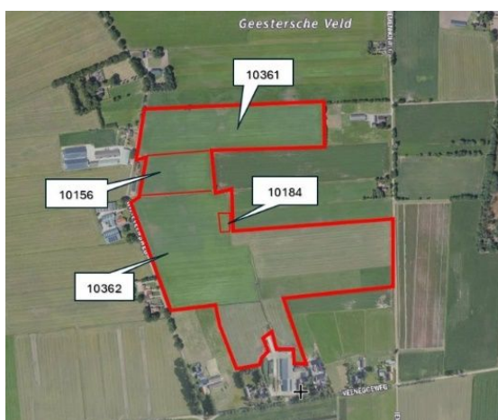
Figuur 1. percelen waarop in beoogde situatie geweid gaat worden

De bovengenoemde percelen beschikken zonder uitzondering over een doorlopend planologische regime die het uitrijden van mest toeliet en momenteel ook toelaat. Verslechtering van de kwaliteit van Natura 2000-gebieden ten opzichte van de relevante referentiedata door het weiden van landbouwhuisdieren is daardoor uitgesloten.