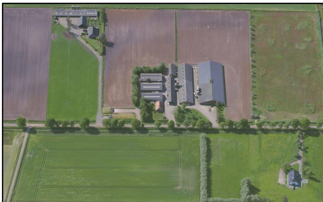
Afbeelding 1: luchtfoto plangebied Langsweg 2 te Dalmscholte