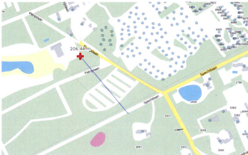
Figuur 1. Afstand padelbaan tot dichtstbij zijnde woning (perceel) is meer dan 200 meter.