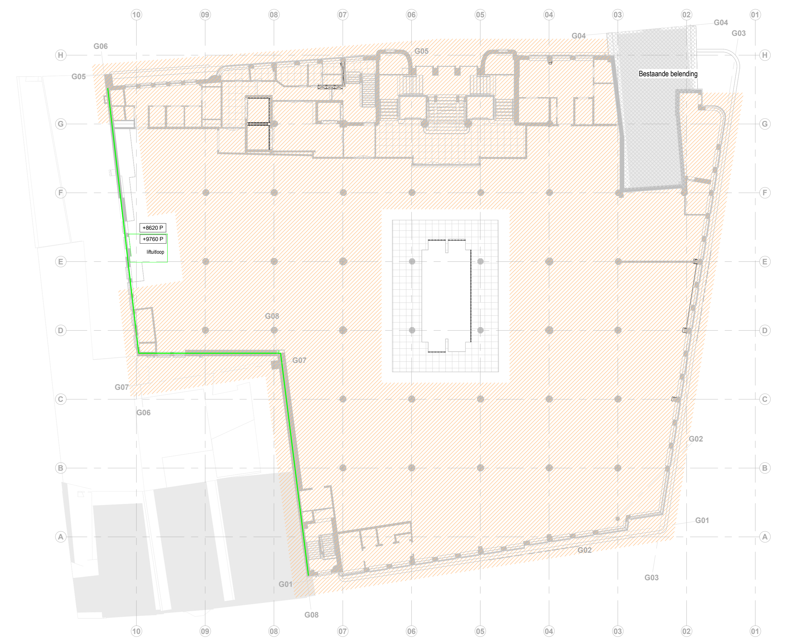
02 tweede verdieping