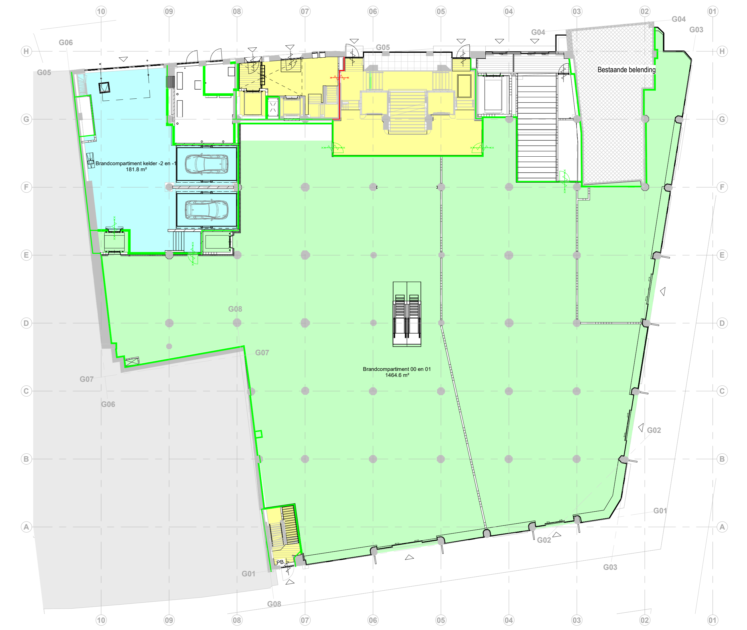
00 begane grond