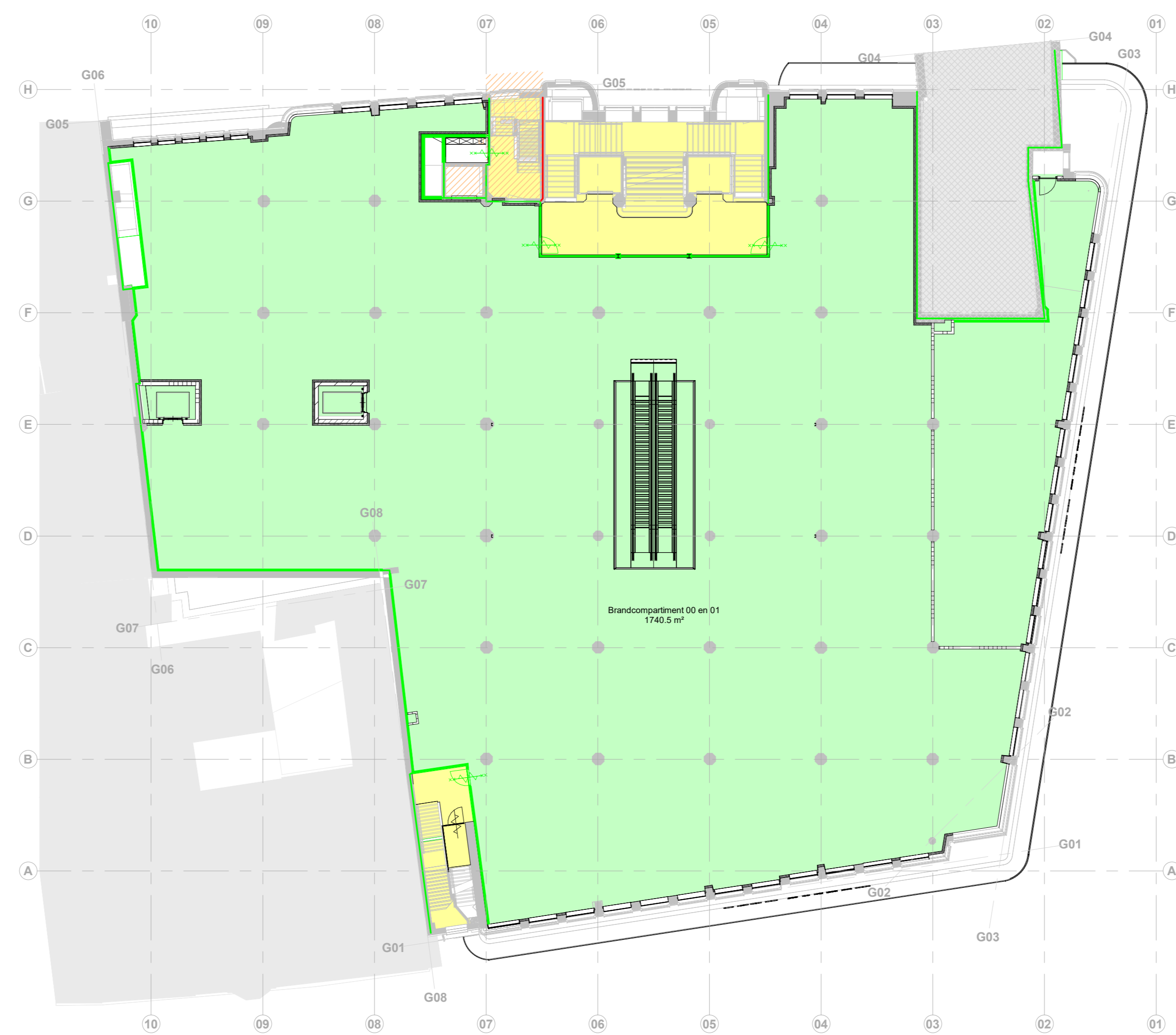
01 eerste verdieping