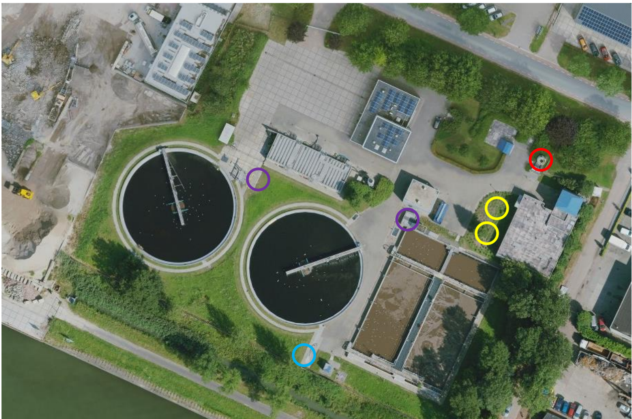
Figuur 2: Locaties beschreven wijzigingen.

De twee ventilatoren van de nieuwe lavafilters (zie gele cirkels). De oude lavafilter van de waterlijn (rood omcirkeld) wordt geamoveerd. Deze is daarom niet meer opgenomen in de berekeningen van de nieuwe situatie. Ten behoeve van de extra beluchting wordt er een blower geplaatst, zie blauwe cirkel. Voor het retourneren van het korrelslib worden er twee C-AGS retourslibpompen geplaatst, zie paarse cirkels. Zie onderstaande figuur.