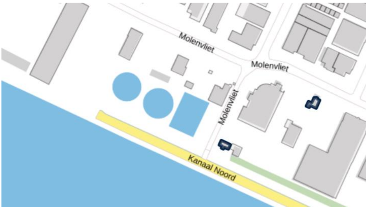
Figuur 1: Situering RWZI

Onderstaande figuur geeft de ligging van de rwzi, met daarbij (vet omkaderd) de ligging van nabijgelegen woningen op het bedrijventerrein. Bijlage 1 geeft een overzicht van de rwzi met de aanwezige installaties.