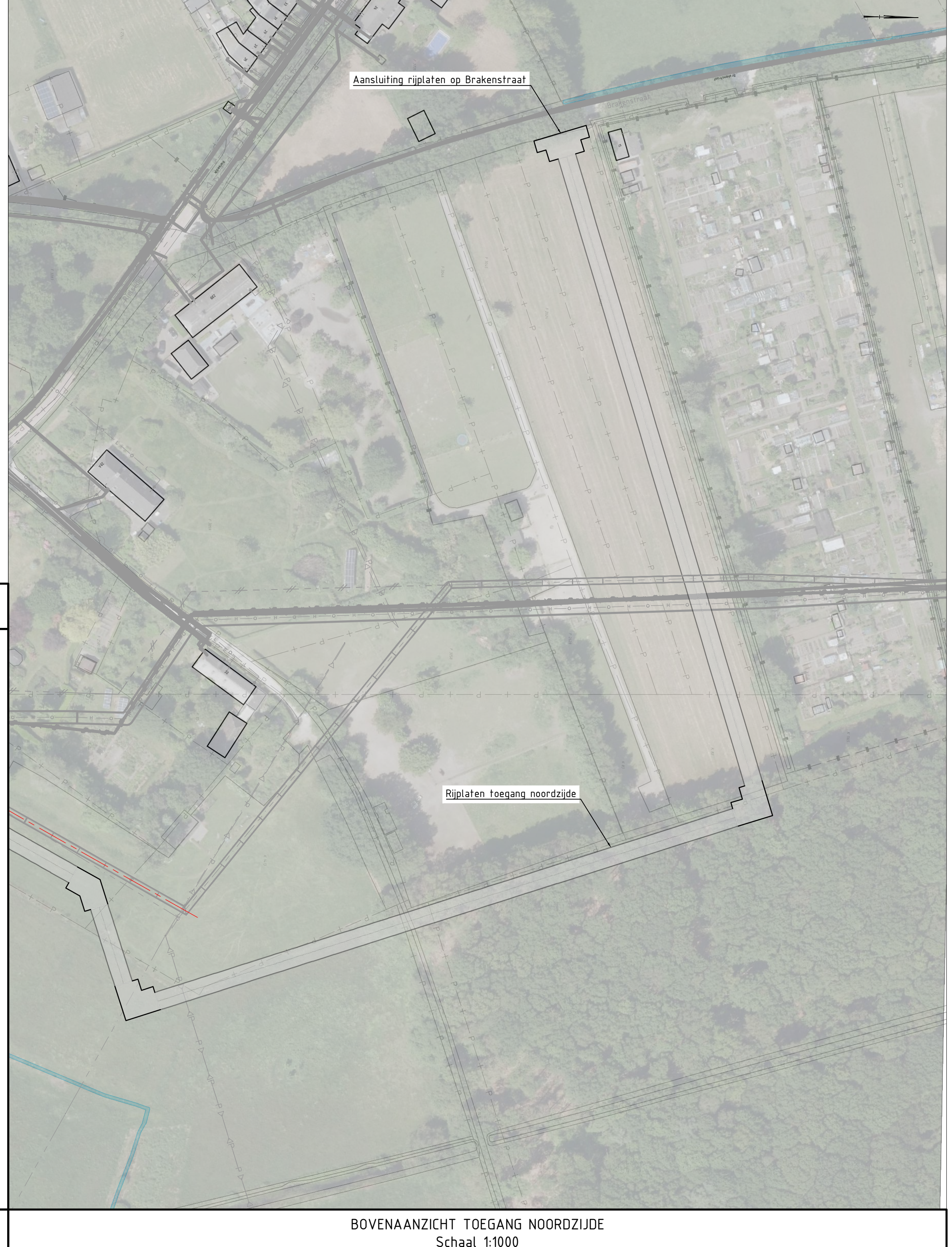
BOVENAANZICHT TOEGANG NOORDZIJDE Schaal 1:1000

Uitgangspunten: Topo ondergrond: BGT Kabels en leidingen: KLIC Levering_2400021676_1, Levering_2400021677_1, d.d. 13-02-2024 Kadastrale grenzen: Kadaster Inmeting bestaand riool: BG5426_BRiool_inmeting_00 Inmeting groenvoorzieningen: B19760_BGroenopstanden ingemeten ZR Grens: BG6814 - ZR grens Tracé omleiding: B19760_AS BUILT_Tracé_Omleiding, d.d. 19-11-2019 Inmeting groenvoorzieningen: BG6814-TE-VO-3201 - Transportriool, d.d. 07-02-2021 Ligging nieuwe putten: 23.149_WP_TM_Voorstel Putten_V1.0_20240312, d.d. 12-03-2024 Proefsterven: 23149-240322A_PROEFSLEUF.dwg, d.d. 22-03-2024 Inmeting bodem: 23149-240322A_INMEET BOMEN.dwg, d.d. 22-03-2024 Boringen bodemonderzoek: BG6814 - boringen bodemonderzoek.dwg