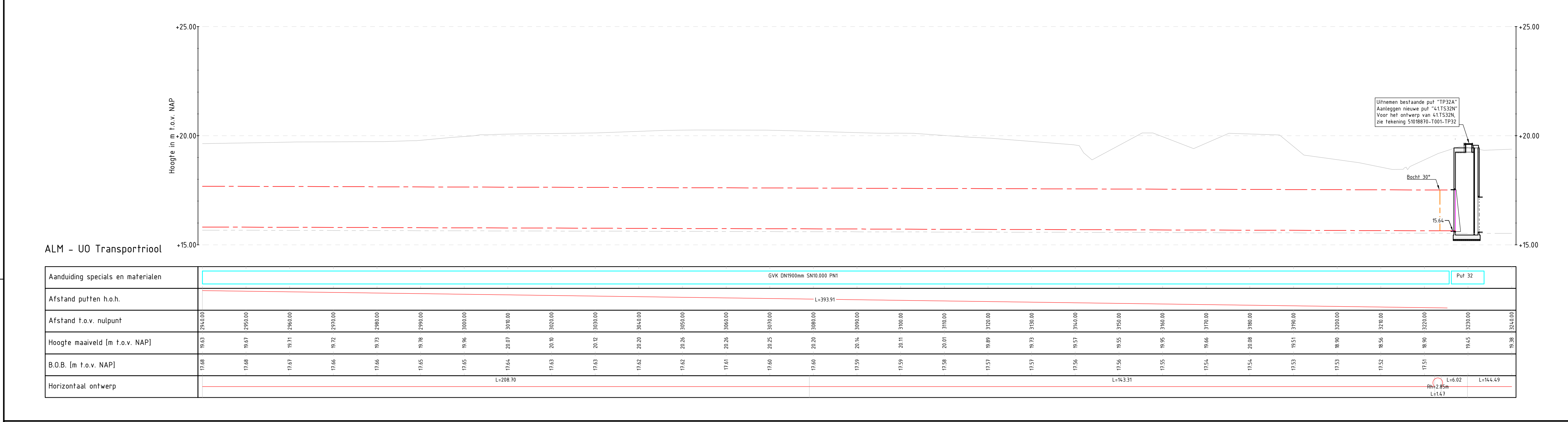
LENGTEPROFIEL Schaal 1:500