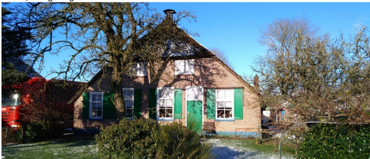
Voorgevel handhaven, herstelwerkzaamheden volgens rapport Monumentenwacht.