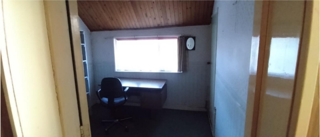
Ruimte aanpassen naar sanitaire ruimte voorhuis