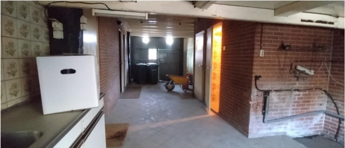
Locatie technische ruimte, sanitair verwijderen.