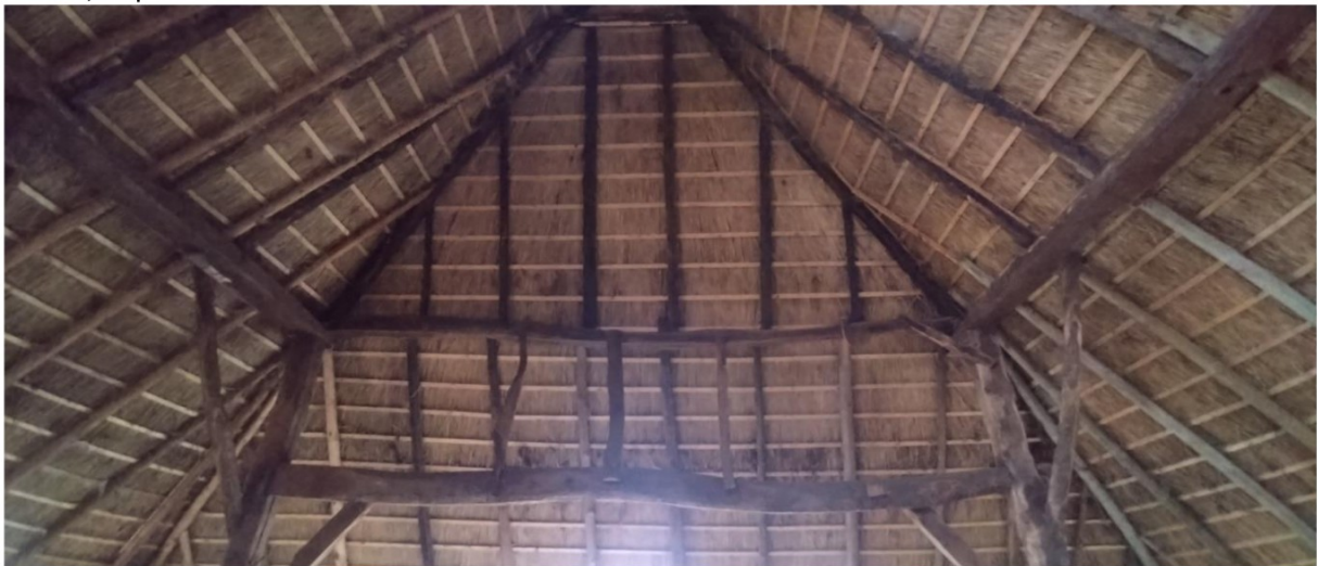
Handhaven, herstelwerkzaamheden volgens rapport Monumentenwacht. Wurmen versterken ivm grote vrije overspanning.