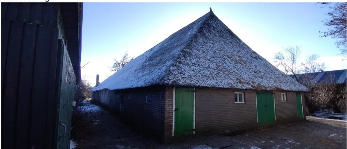
Vervangen volgens rapport monumentenwacht; uitvoeren als schroefdak, dubbeldunne beplating.