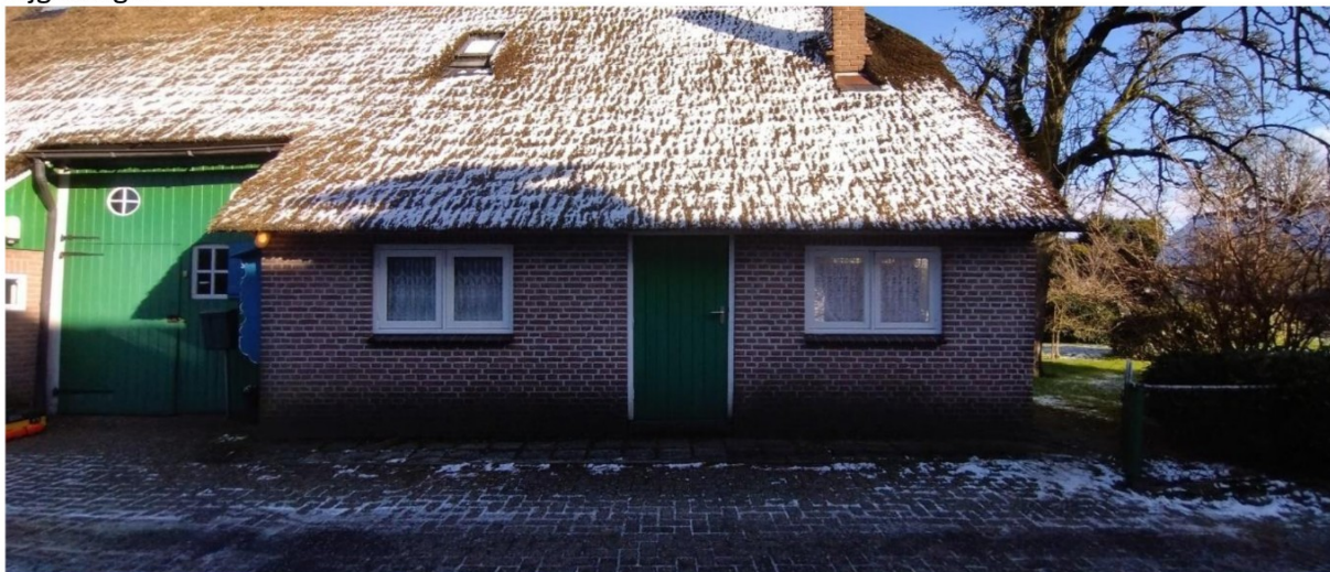
Handhaven, herstelwerkzaamheden volgens rapport Monumentenwacht.