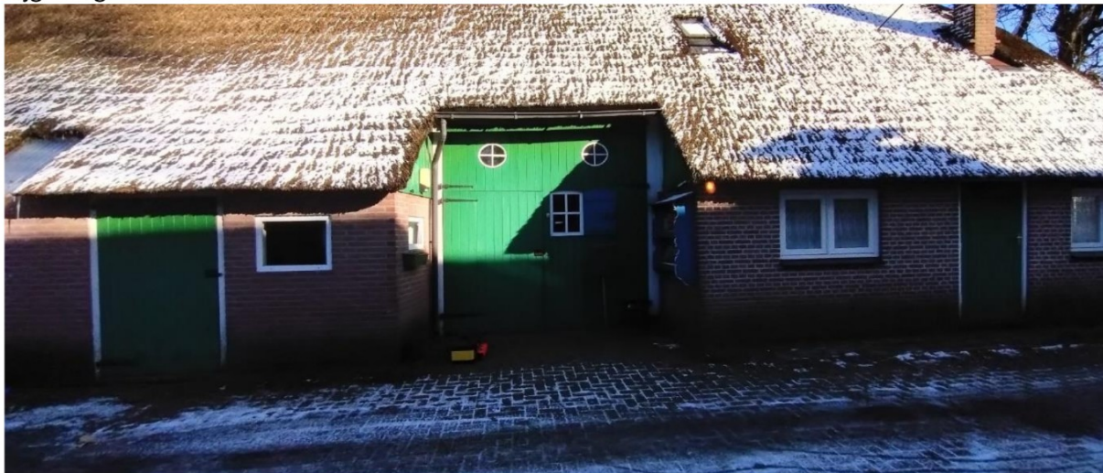
Zijgevel g03 & 04