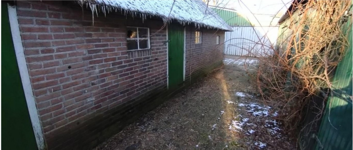
Gevel tot inboetwerk vervangen, achterste deel handhaven.