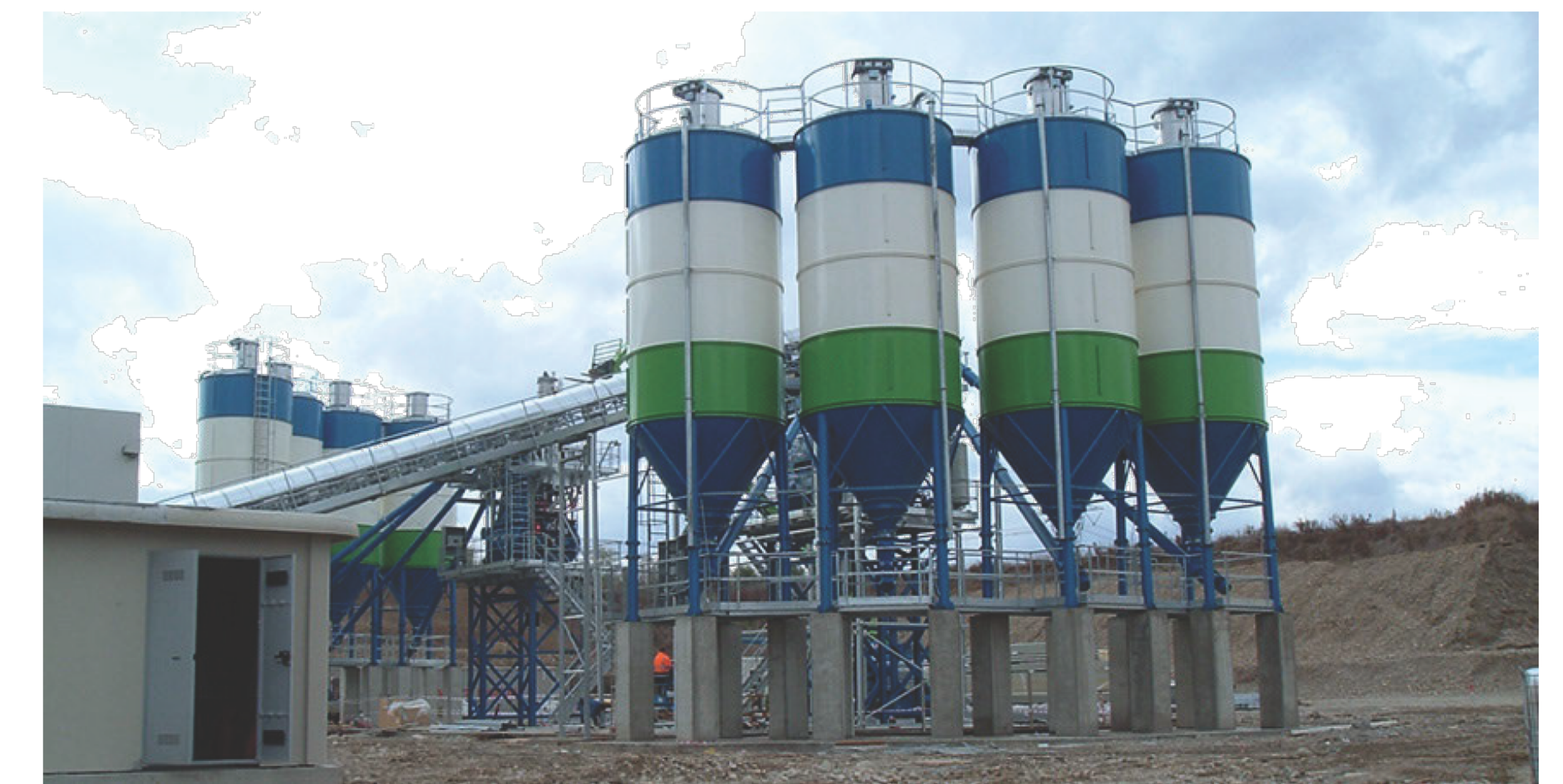
referentiebeeld filterinstallatie (dust collector)