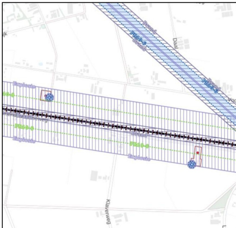
Afbeelding 4 Uitsnede plangebied uit Risicokaart

Het aspect externe veiligheid vormt geen belemmering voor de beoogde ontwikkeling.