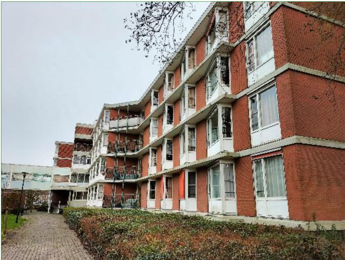
Impressie van de bebouwing.

Hoofdstuk 7 tenslotte, geeft een overzicht van de gebruikte literatuur. In de bijlages is aanvullende informatie opgenomen over de geldende wetgeving en de gebruikelijke procedures bij een vergunningsaanvraag. Eventueel zijn (indien relevant) verspreidingskaarten opgenomen.