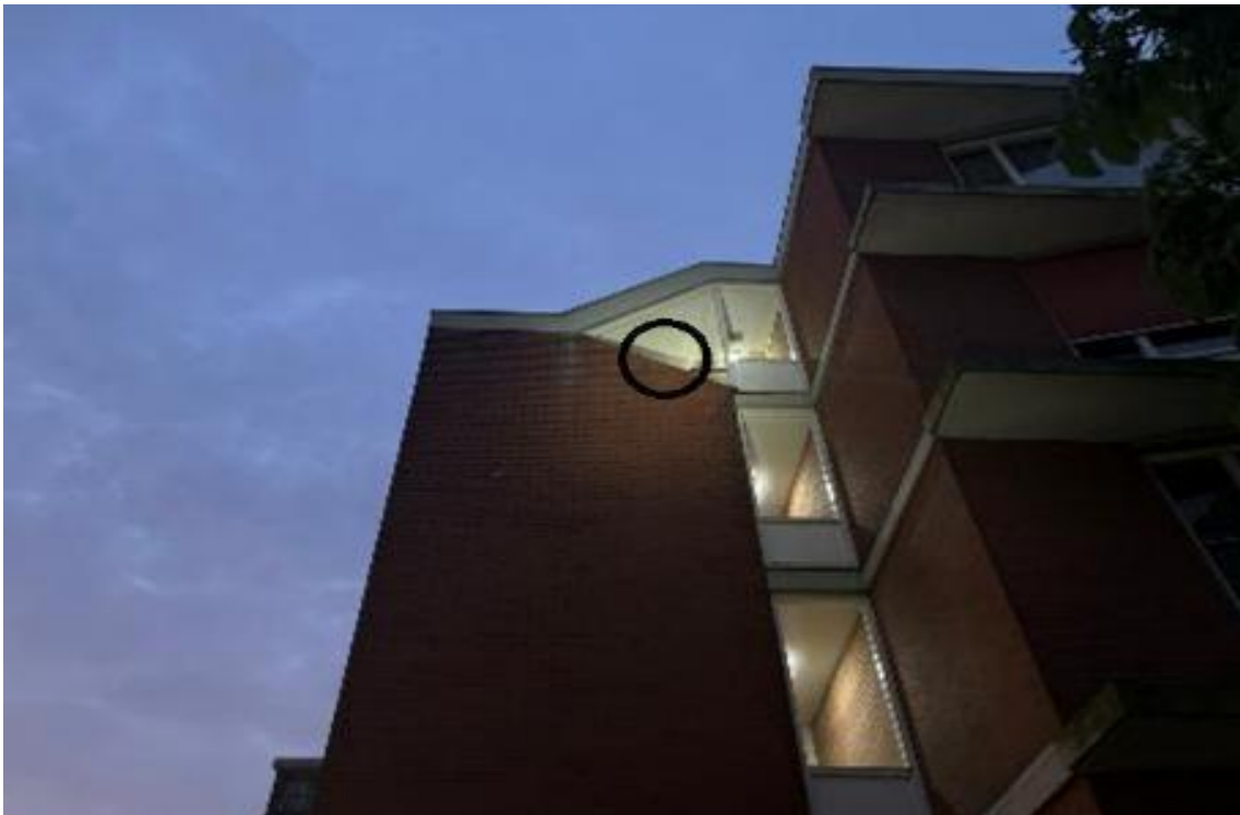
Afgebrokkeld metselwerk dat toegang geeft tot de spouw aan de zuidzijde van de bebouwing.

Er wordt uitgegaan van twee zomerverblijven, gebruikt door één vleermuis. De verblijven bevinden zich hoogstwaarschijnlijk in de spouw. Mogelijk worden later in het jaar de verblijfsruimtes gebruikt als paarverblijfplaats. Vanwege de positie in (vermoedelijk) een spouwmuur, lijkt gebruik als (warm) winterverblijf mogelijk.