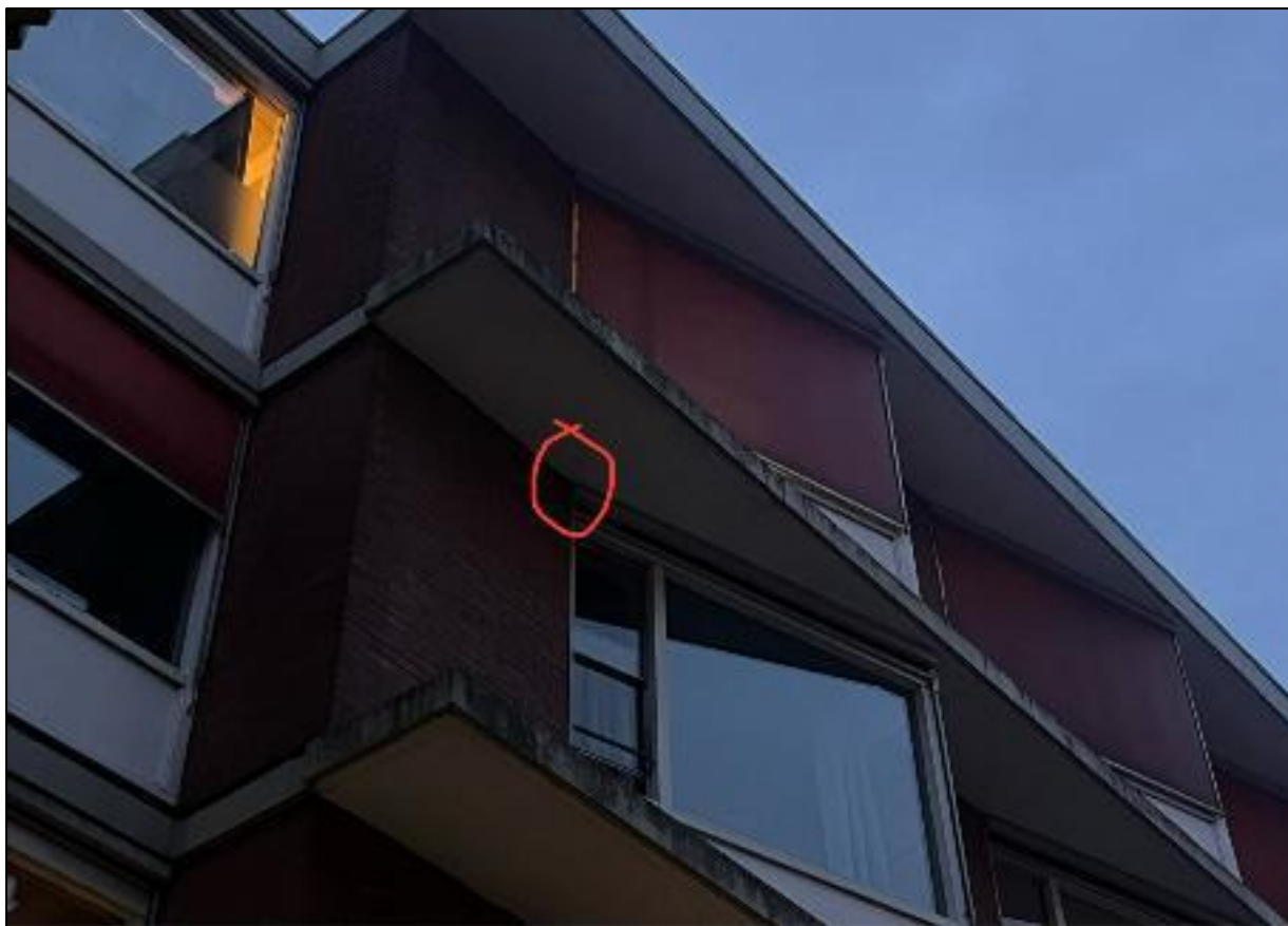
Een van de uitvlieglocaties KZ3.

Tijdens de tweede ronde van het onderzoek werd een invliegende Gewone dwergvleermuis waargenomen aan de westgevel van de bebouwing. Het dier vloog uit een kozijn van een raam. Er wordt uitgegaan van een zomerverblijf met één solitair mannetje.