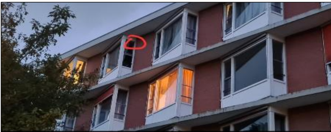
Invlieglocatie Gewone dwergvleermuis KZ2.