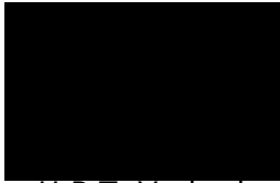
H.P.T. Verberk Regisseur omgevingsvergunningen

Met vriendelijke groet, namens burgemeester en wethouders van Deurne