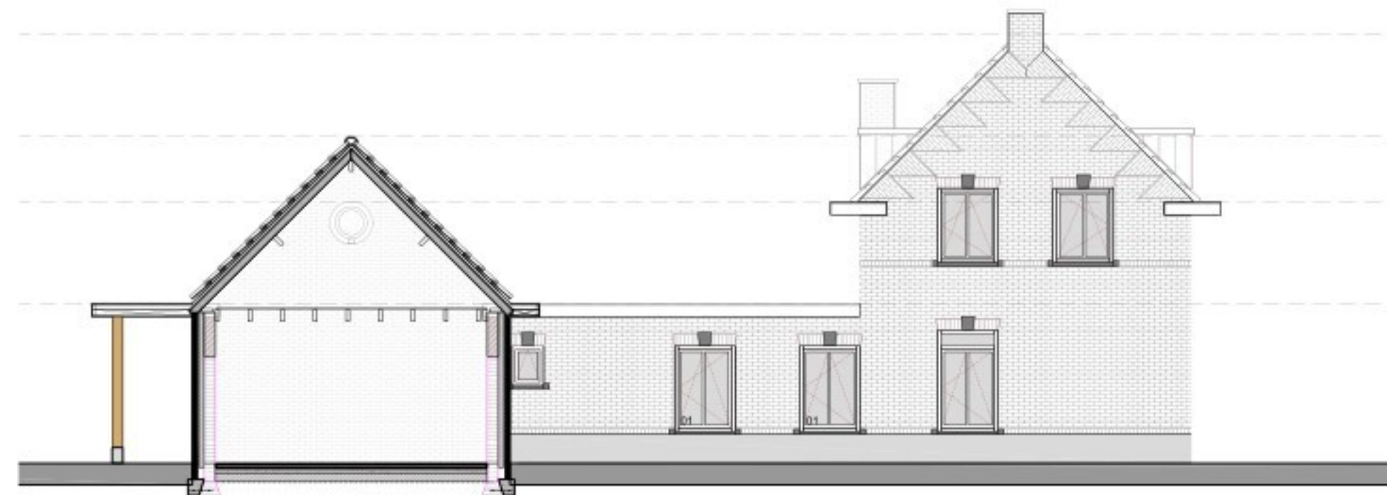
LINKER ZIJGEVEL NIEUW