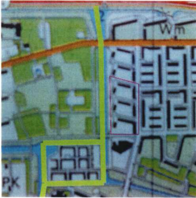
Plangebied, roze omrand.