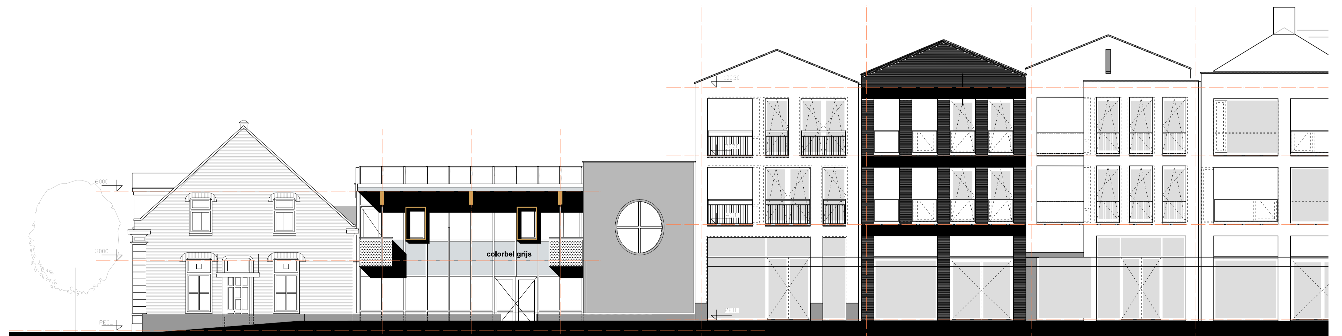
Nieuwe Gevel de Wever

Voorstel functie Wonen begane grond 1319 S01 i.o.v. Oude Martinetstraat 11 te Deurne