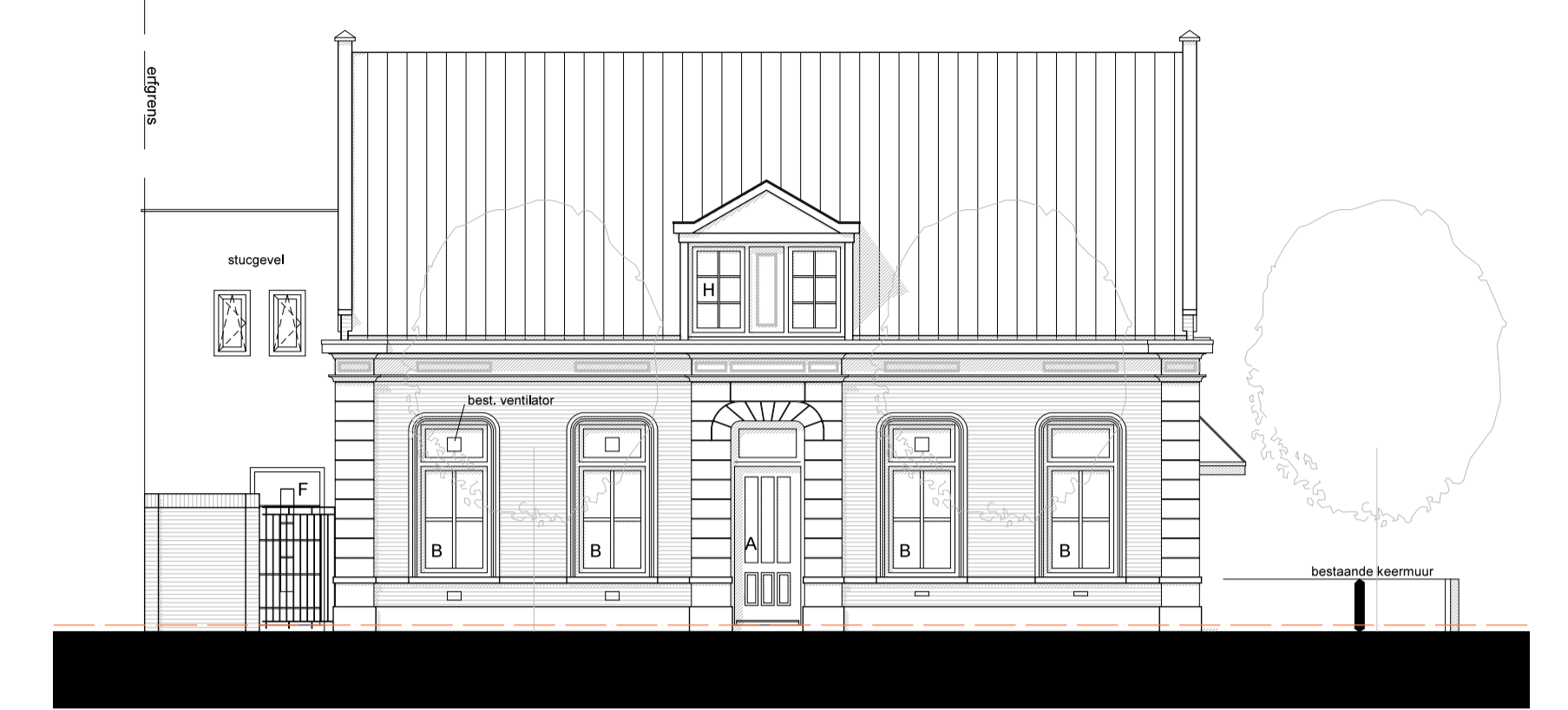
Nieuwe Voorgevel Oude Martinetstraat