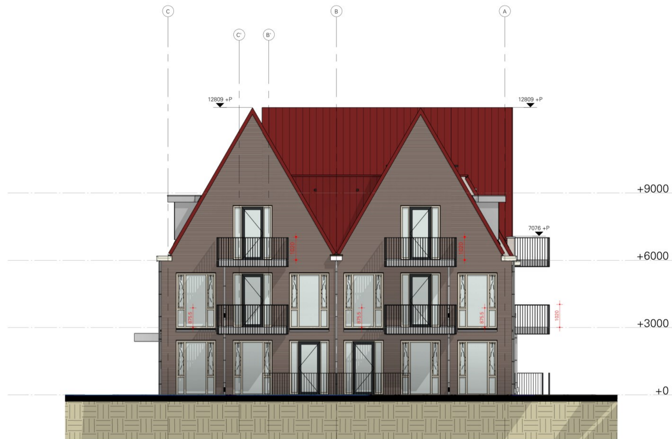
Linkergevel 1 : 100

hekwerk voor de begroeiing met klimplanten