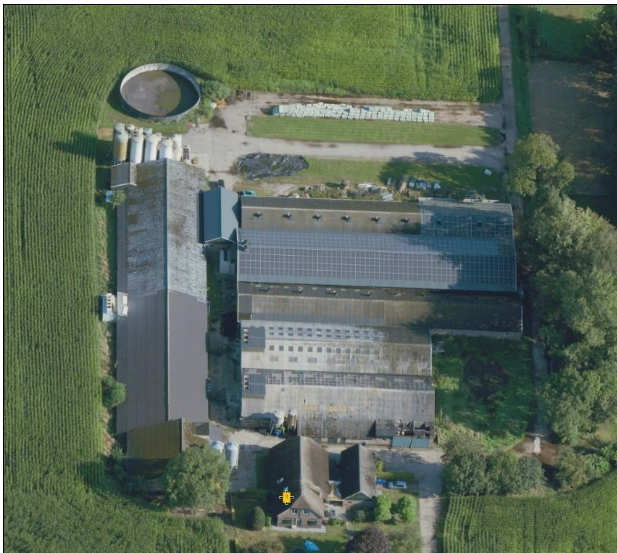
Figuur 1 Luchtfoto perceel Velnerweg 1 te Wijhe

Een luchtfoto en topografische kaart met daarop de ligging van de locatie is in navolgende figuren weergegeven.