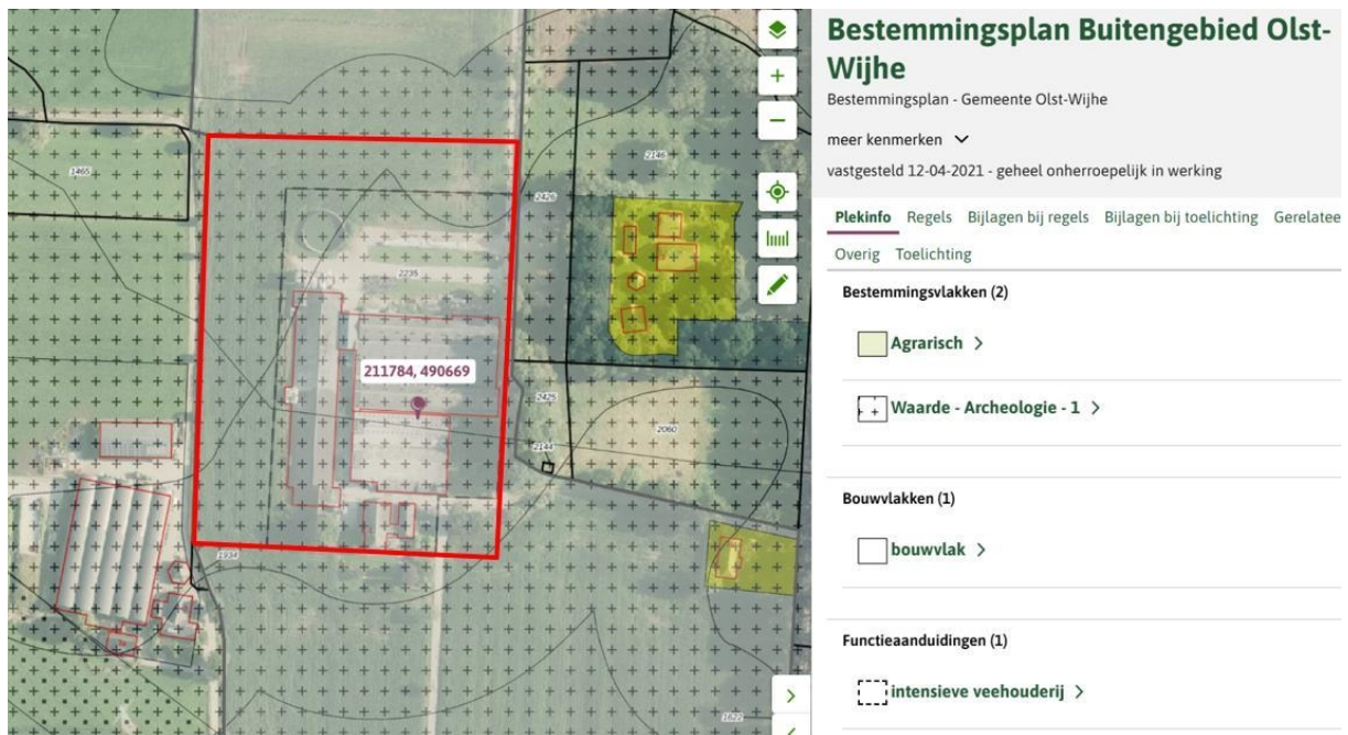
Figuur 1: Overzichtskaart omgeving projectlocatie met vigerend bestemmingsplan.

De Velnerweg komt via de Stoombootweg uiteindelijk uit op de goed ontsloten Hogeweg. De ontsluiting van de locatie vindt dan ook via dit (bestaande) wegensysteem plaats.