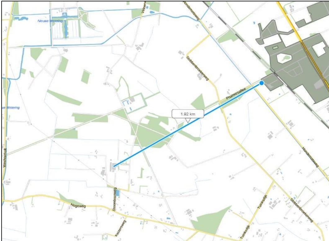
Figuur 2: Overzichtskaart afstand tot dichtstbijzijnde Wav-gebied.

Het dichtstbijzijnde Natura 2000-gebied is "Rijntakken", dat is gelegen op een afstand van ongeveer ruim 5,5 kilometer van onderhavig bedrijf. In navolgende afbeelding is het voornoemde weergegeven.