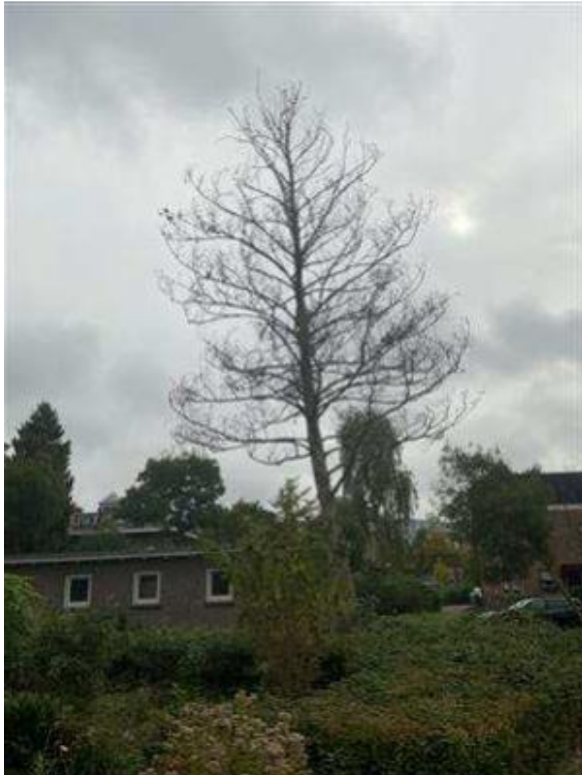
Foto 1. Foto van de afgestorven els