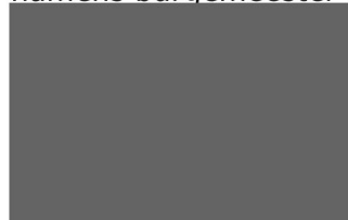
H.P.T. Verberk regisseur omgevingsvergunningen

namens burgemeester en wethouders van Deurne