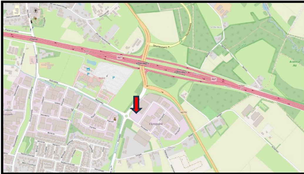
Figuur 1.1: Projectlocatie Greenpoint (Ondergrond: Openstreetmap)