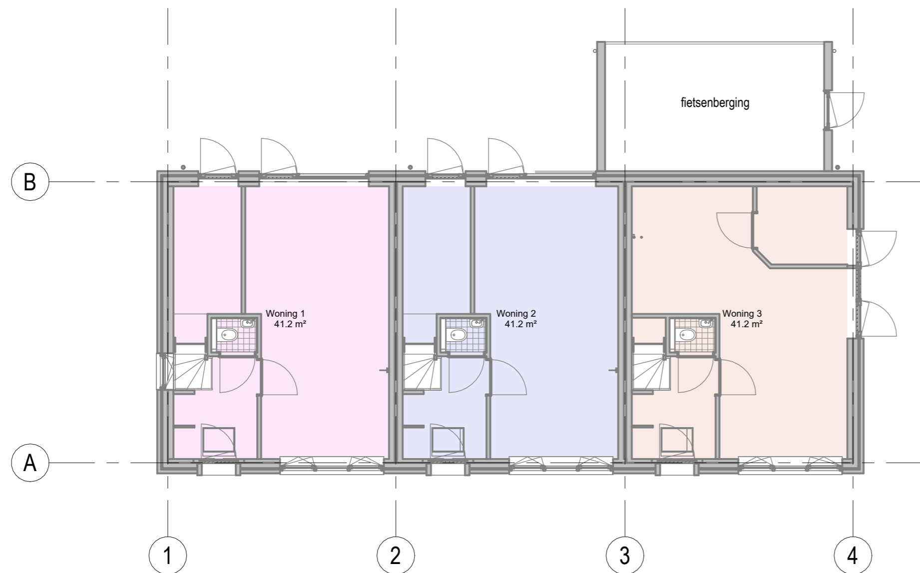
Begane grond 1 : 100