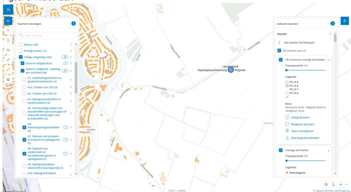
Figuur 3: Risicokaart

Zoals te zien in onderstaande figuur bevindt zich op circa 545 meter rondom de planlocatie een activiteit met opslag van propaan. Er is geen sprake van de ligging binnen een risicocontour in het Omgevingsplan, danwel ligging binnen een aandachtsgebied.