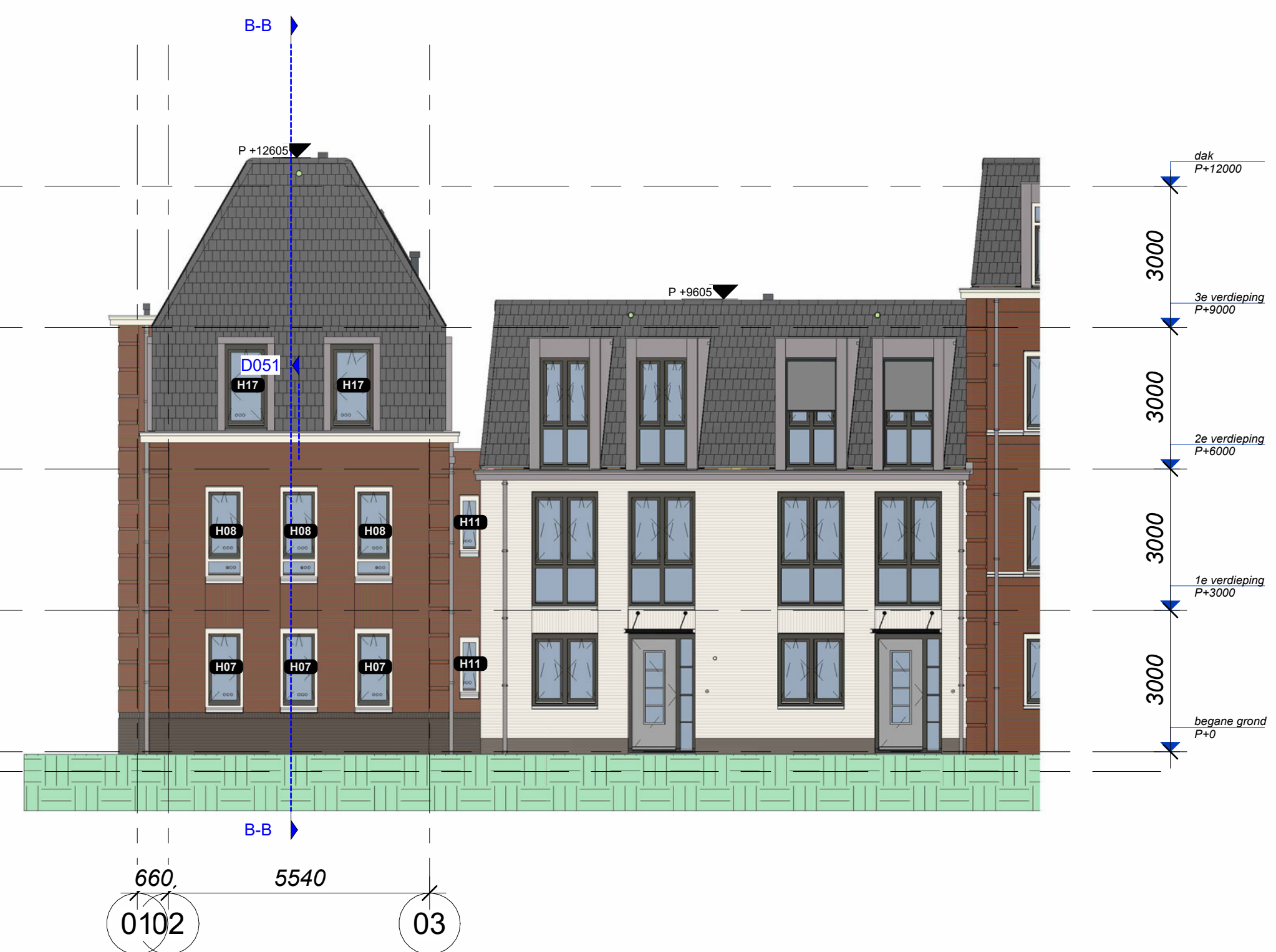
rechtergevel BNR 1 (Westgevel) 1 : 100