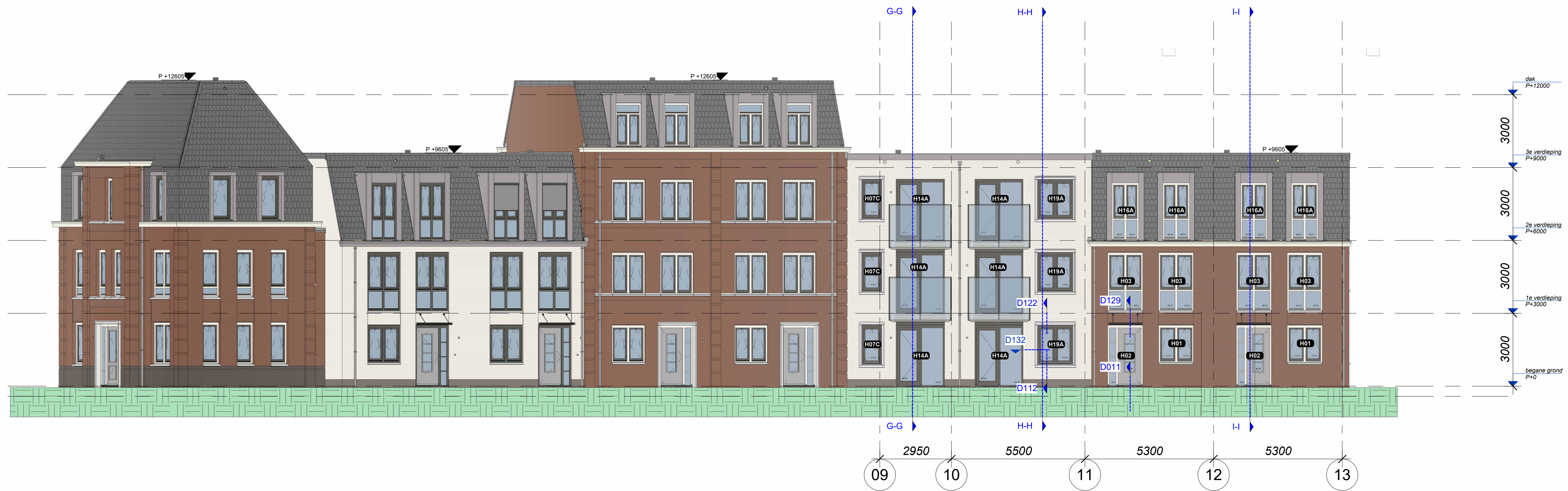
voorgevel Prinses Irenelaan (Westgevel) 1 : 100