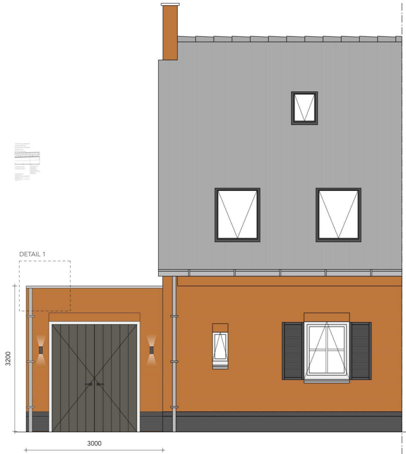
VOORAANZICHT Schaal 1:50 kleurstelling buitenberging gelijk aan woning