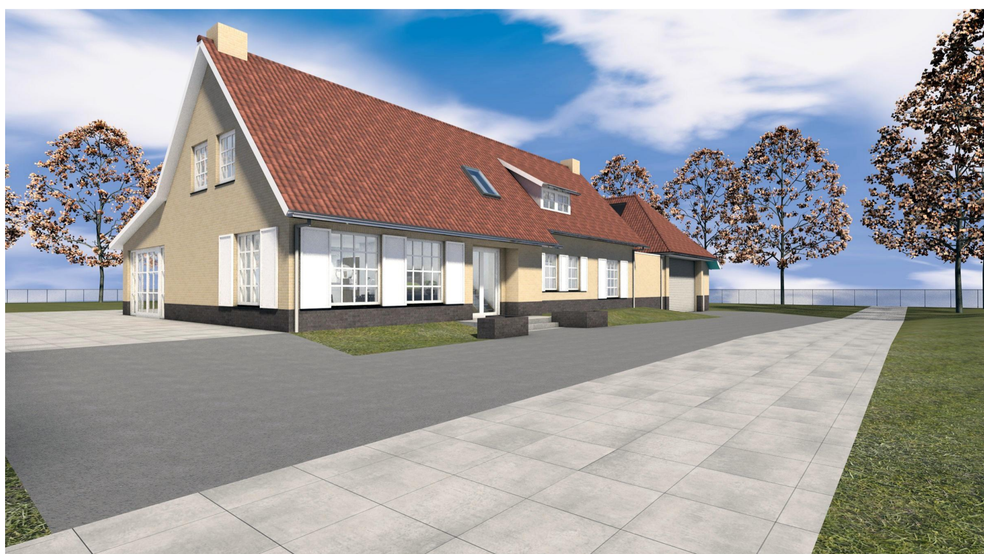
3D voorzijde zuid nieuw D02