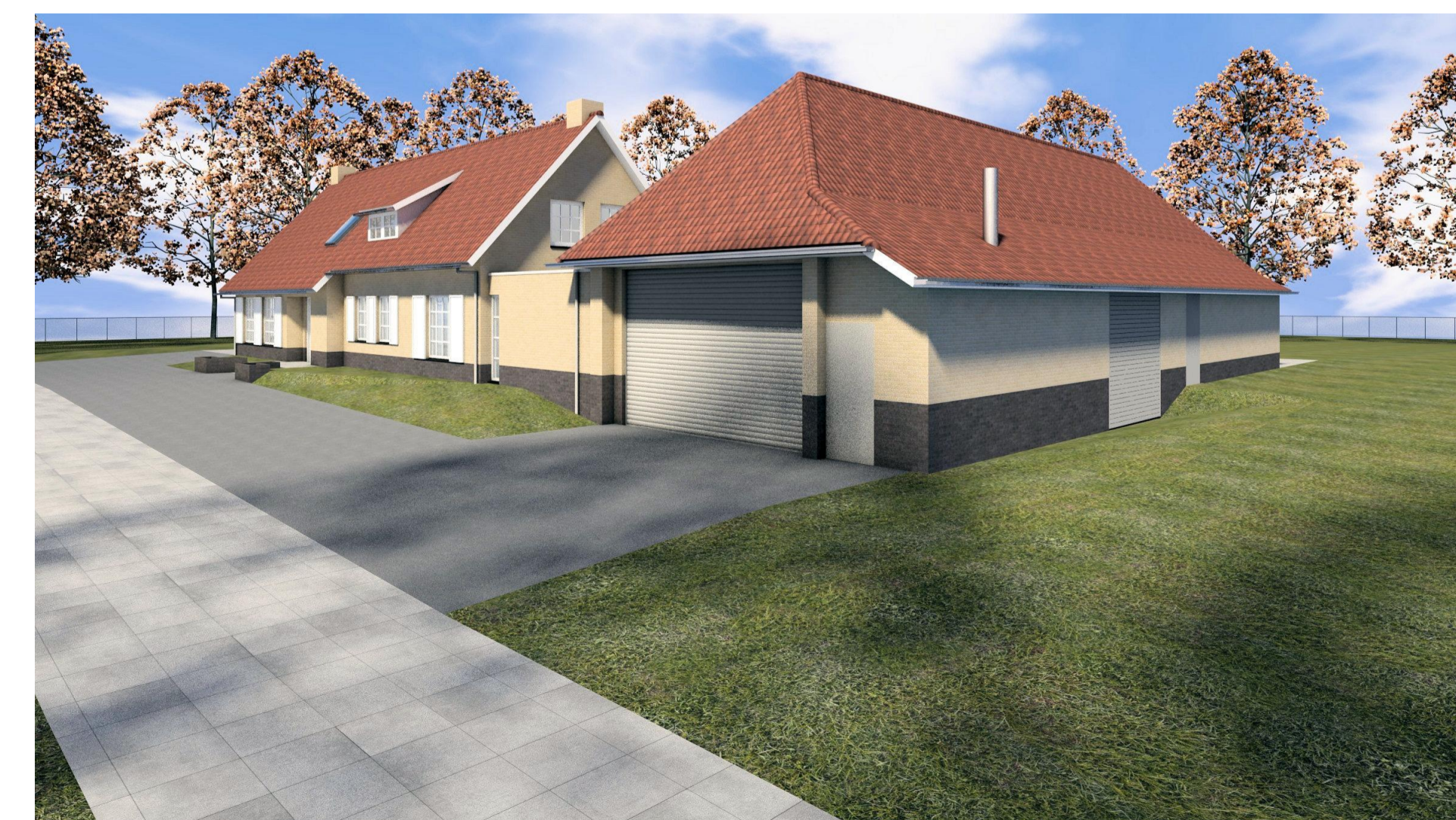
3D voorzijde noord nieuw D02