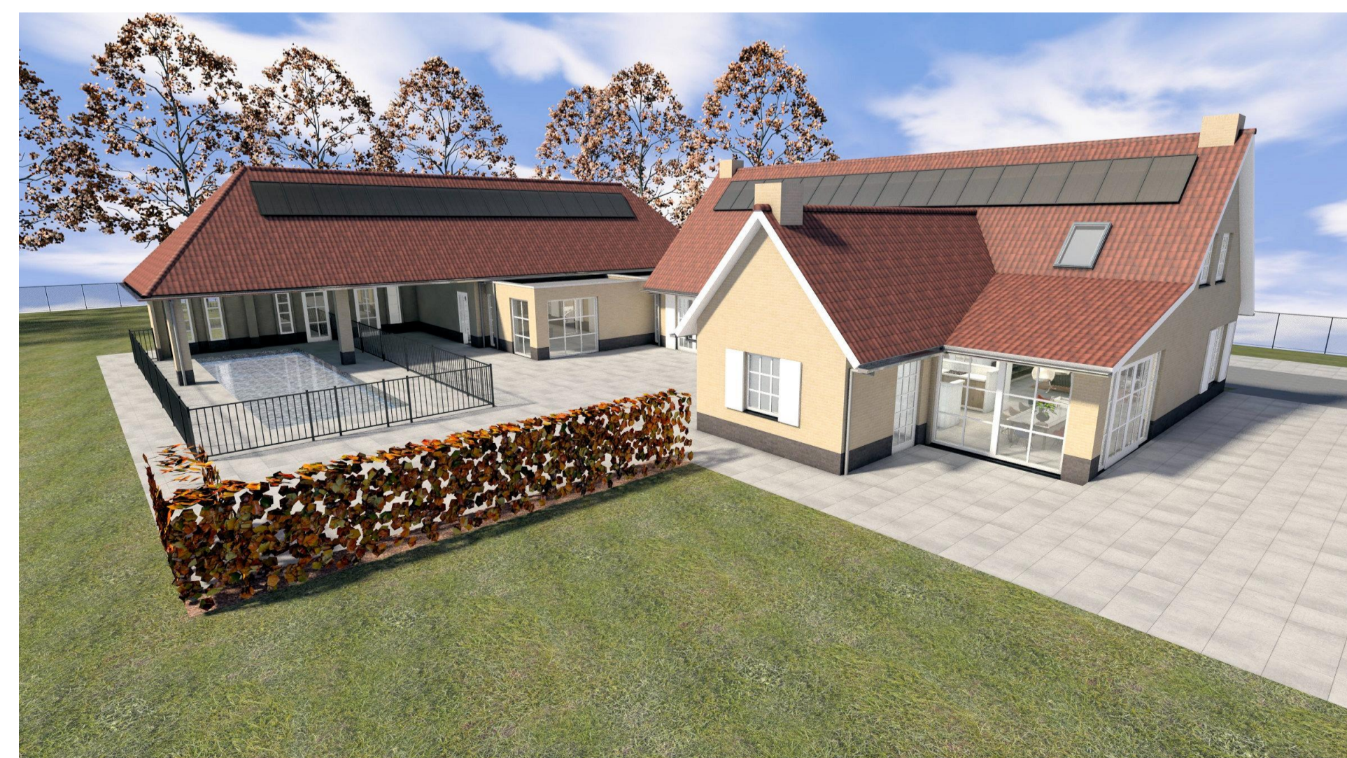
3D achterzijde nieuw D02