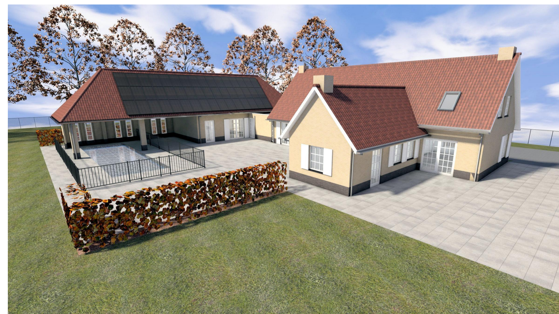
3D achterzijde bestaand D02