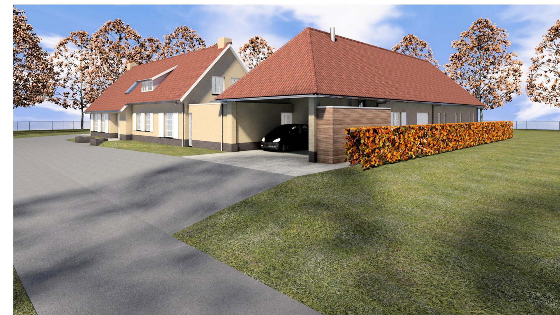
3D voorzijde noord bestaand D02