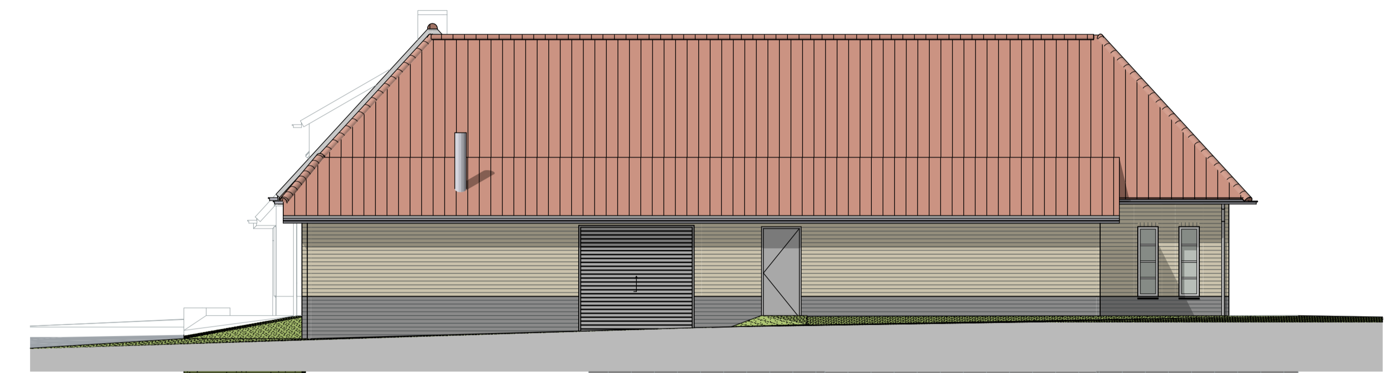
G3 rechterzijgevel nieuw 1:100