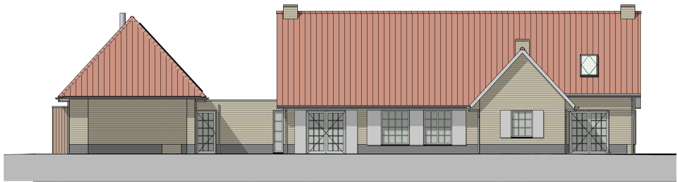
G2 achtergevel bestaand 1:100