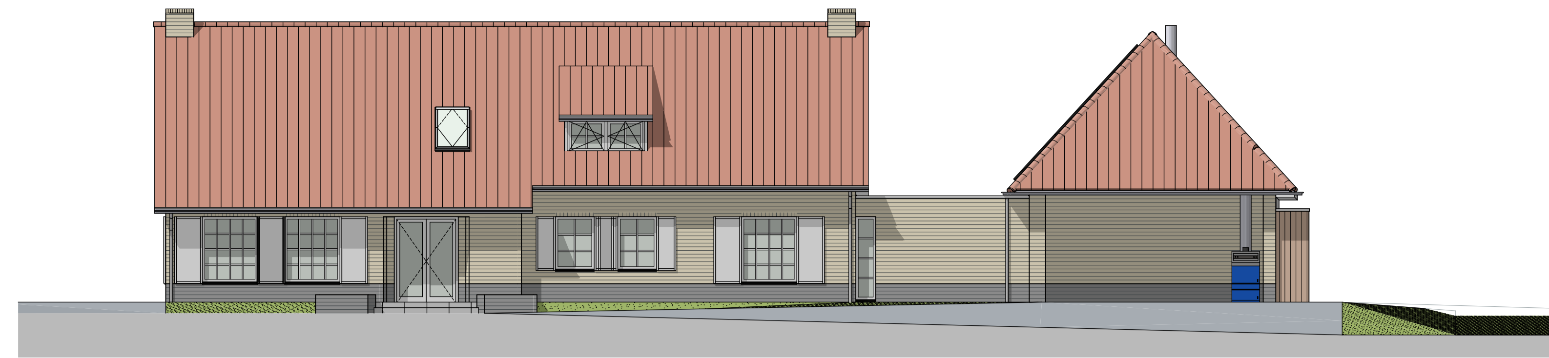
G1 voorgevel bestaand 1:100