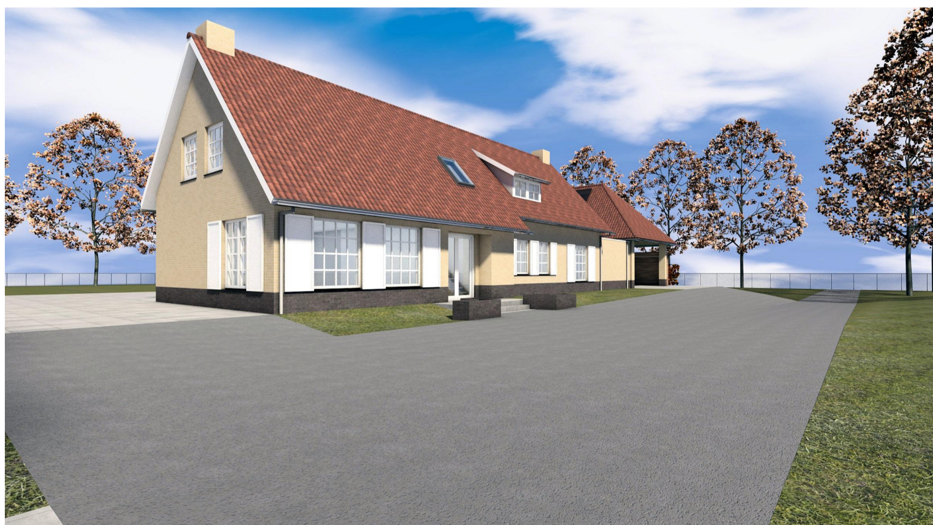
3D voorzijde zuid bestaand D02