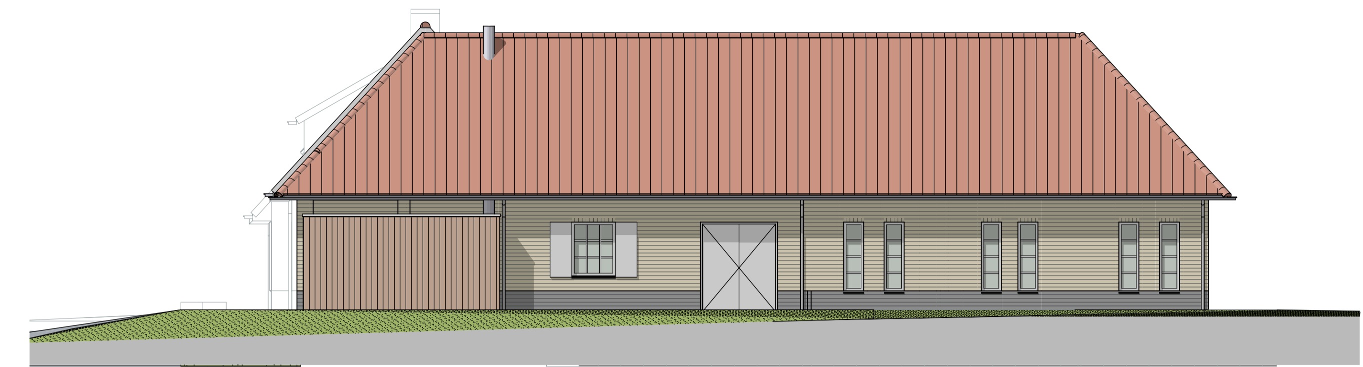
G3 rechterzijgevel bestaand 1:100