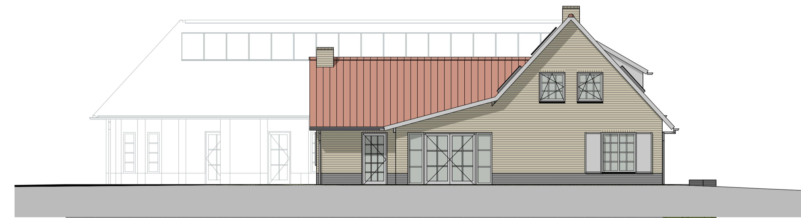
G4 linkerzijgevel nieuw 1:100