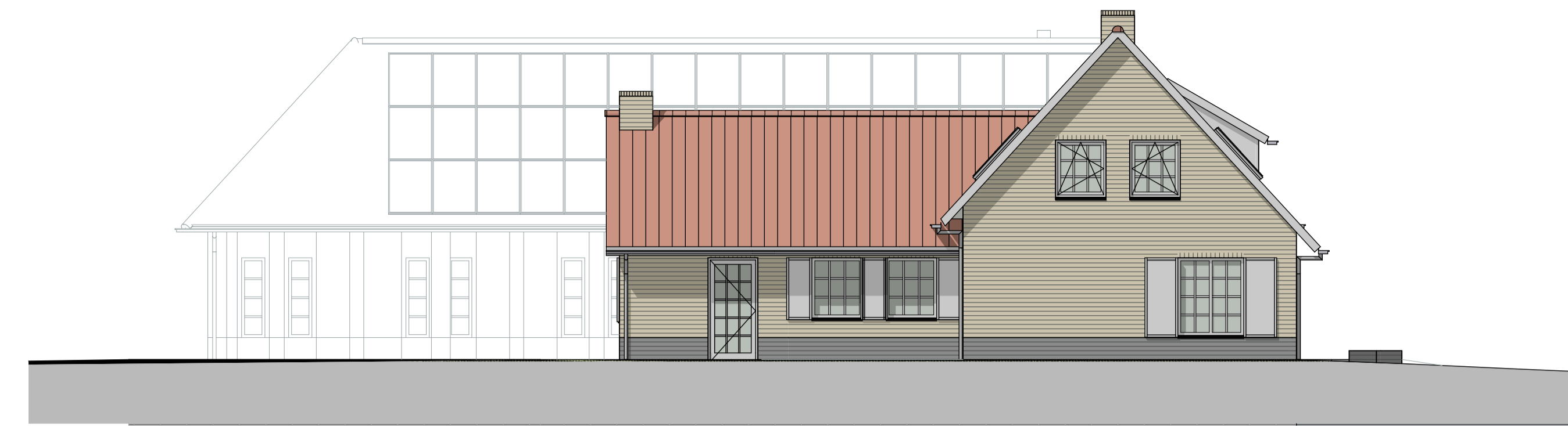
G4 linkerzijgevel bestaand 1:100