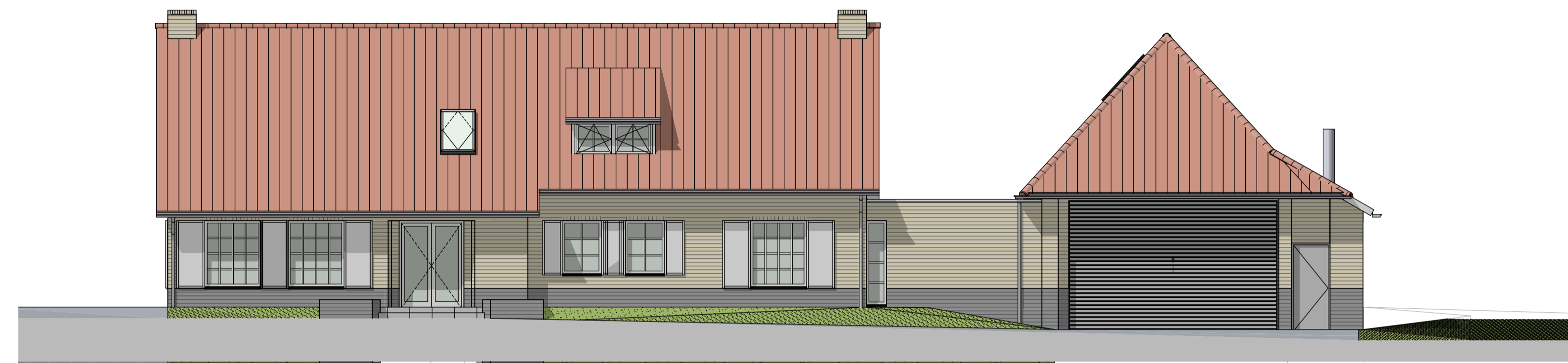
G1 voorgevel nieuw 1:100