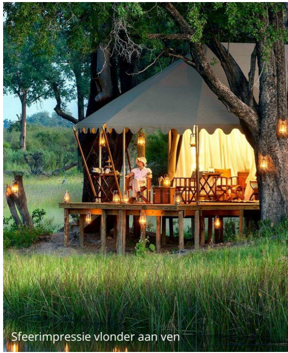
Sfeerimpressie vlonder aan ven