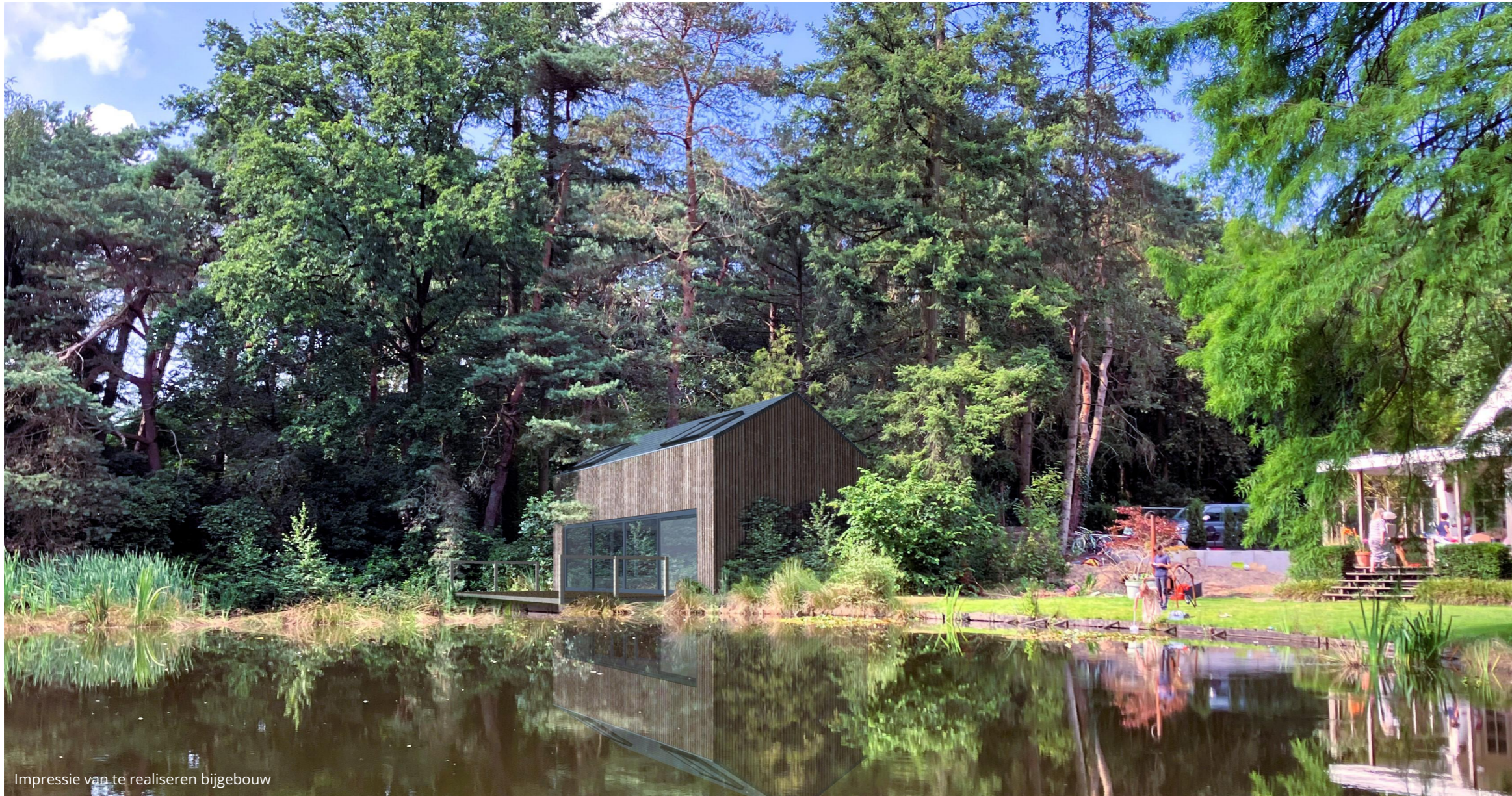
Impressie van te realiseren bijgebouw

SCHOUTEN EGGEN ontwerp en architectuur www.schouteneggen.com