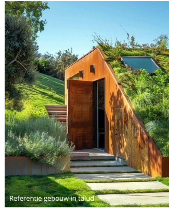
Referentie gebouw in talud