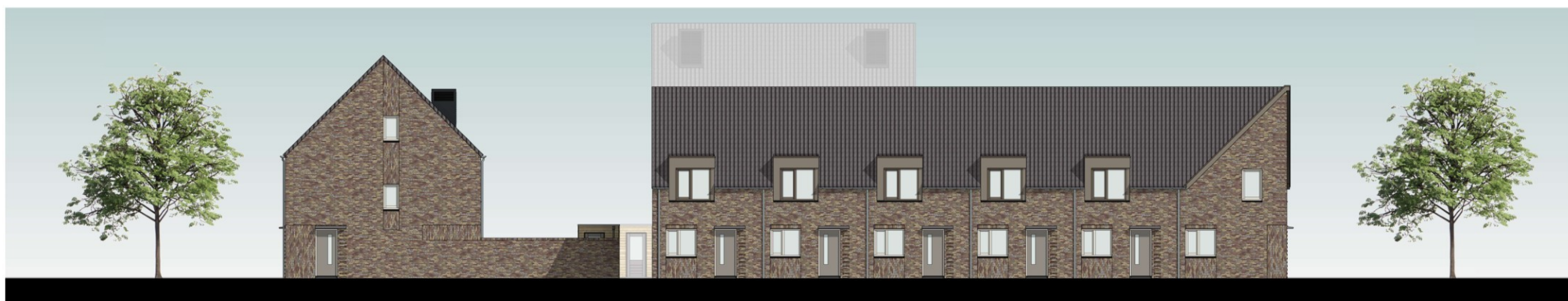
rechter gevel blok B