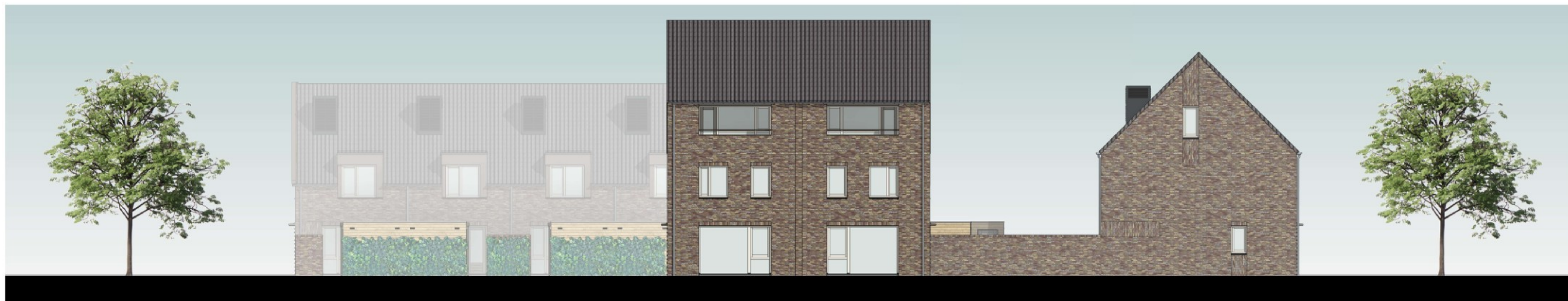
achtergevel blok C