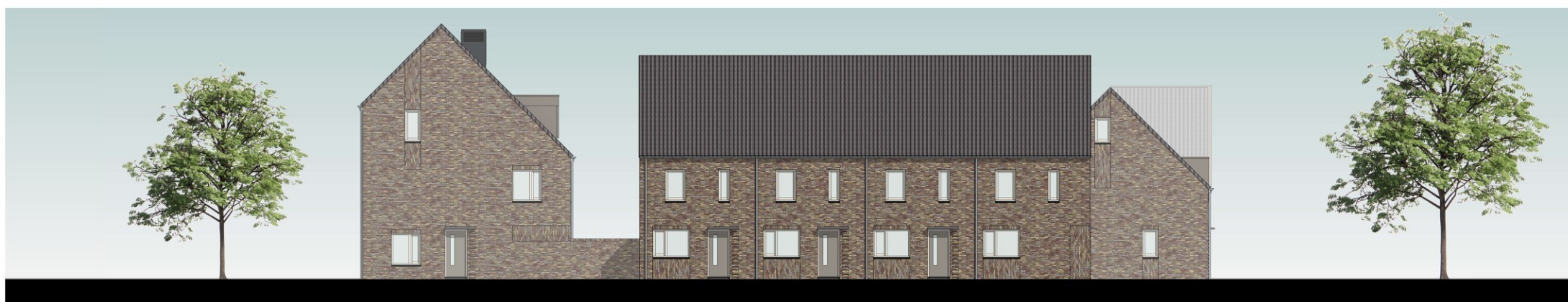
rechter gevel blok A