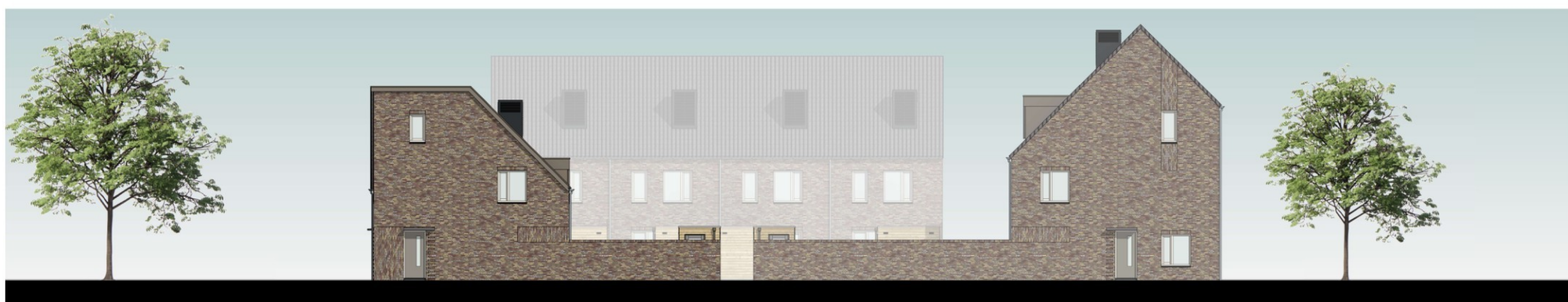
rechter gevel blok C