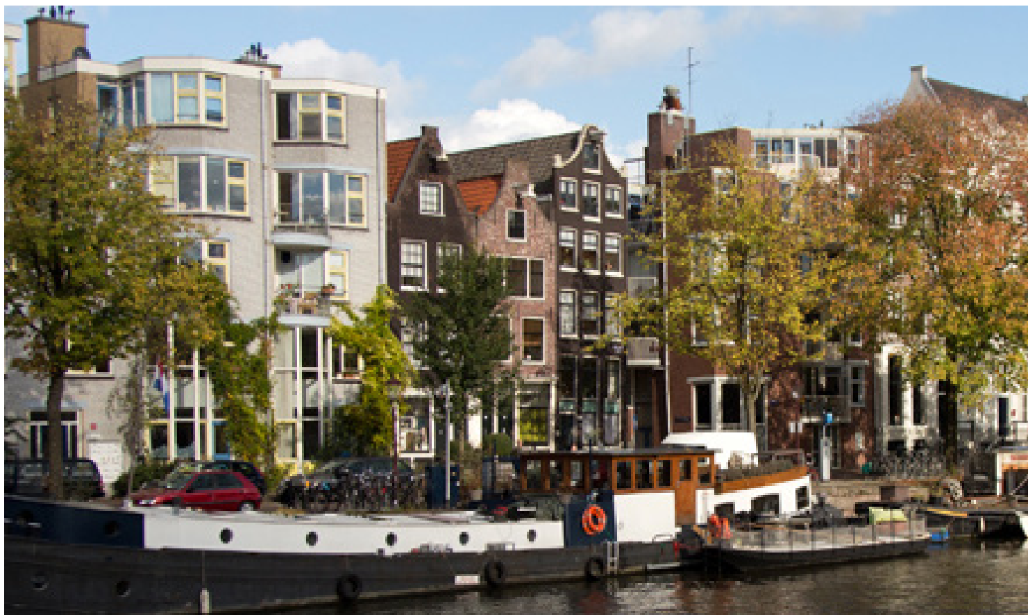
De iep is belangrijkste boom van Amsterdam en is onlosmakelijk verbonden met de historie van de stad. In Amsterdam staan ca. 75.000 iepen.