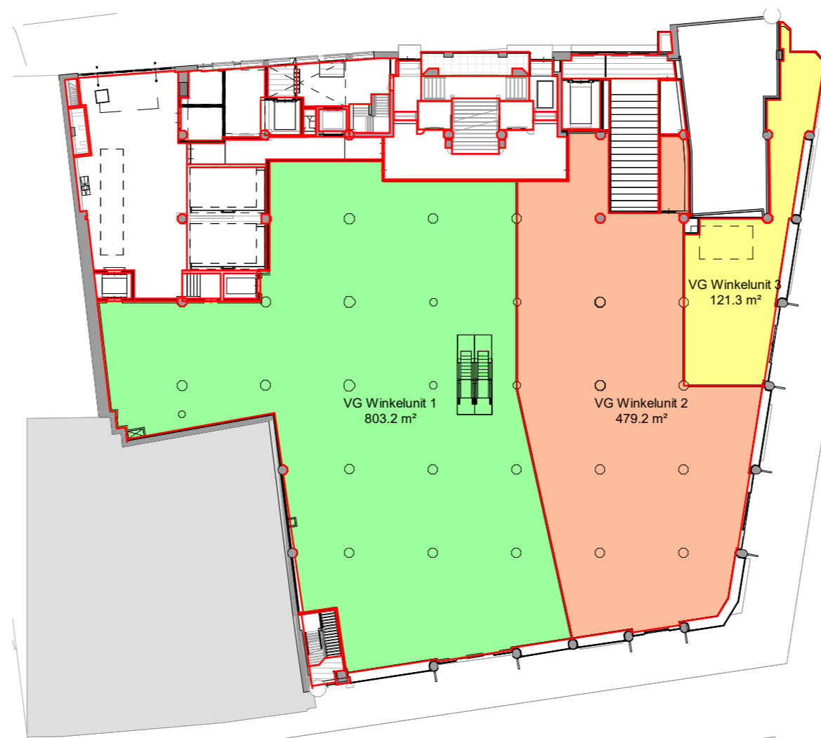
00 begane grond