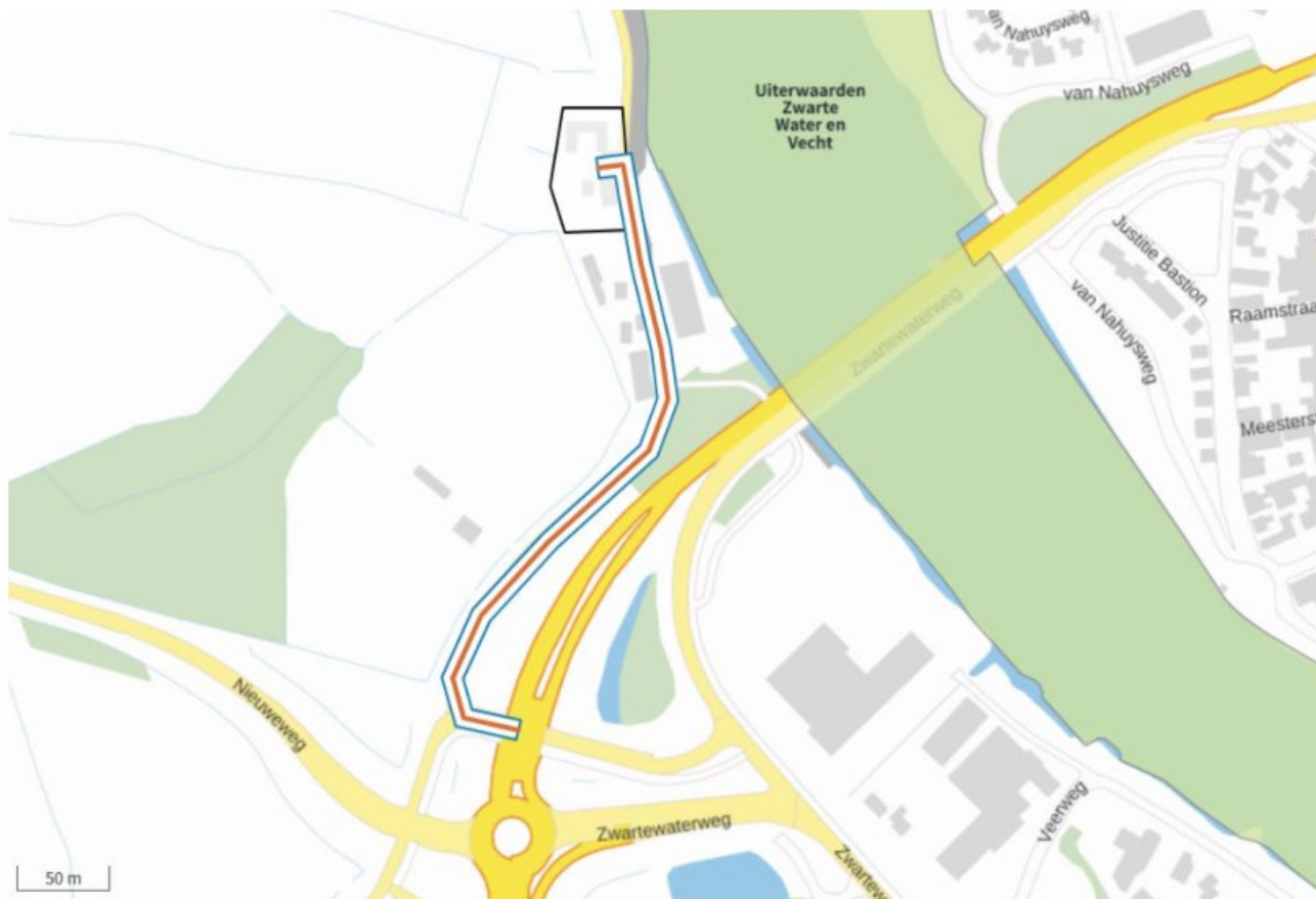
Afbeelding 2.1. Rijroute verkeersbewegingen.