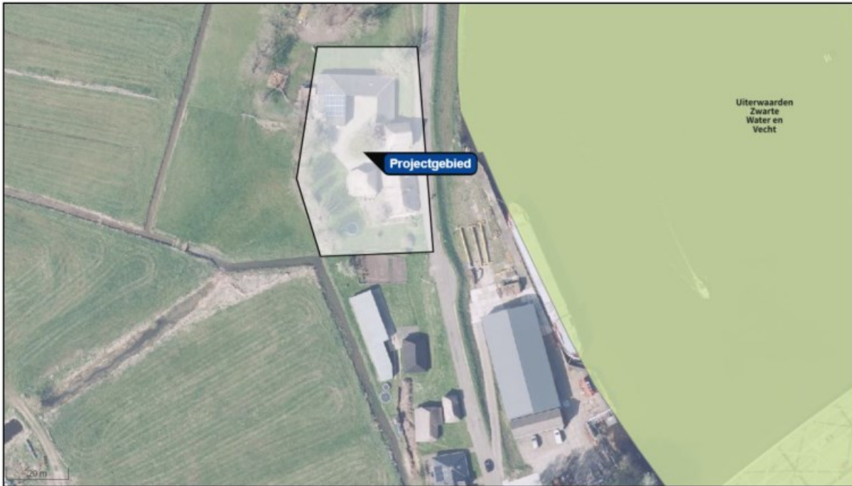
Afbeelding 1.2. Luchtfoto van het projectgebied.