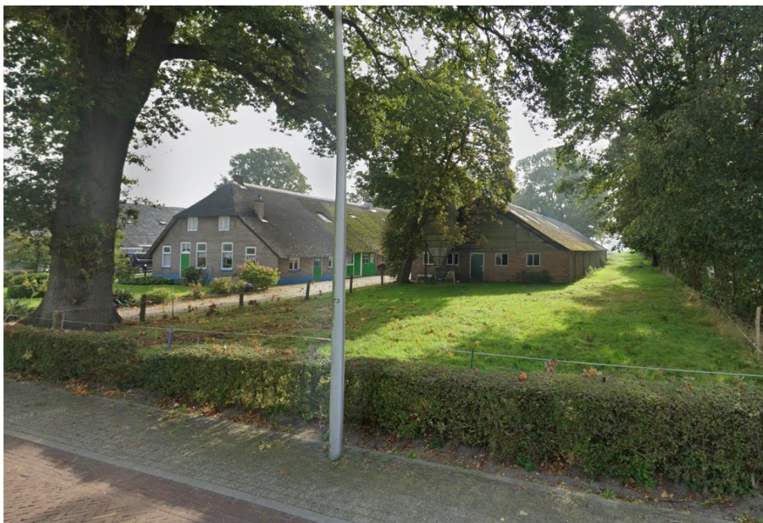
Fig.10; GW 312; Aan oostzijde (Google maps)