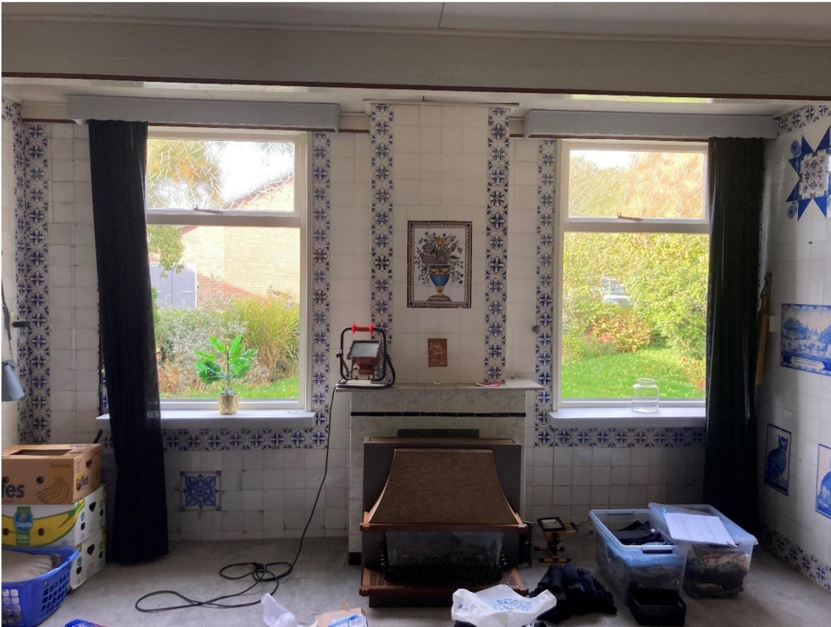
Fig. 43; voorgevel met schouw gaskachel.