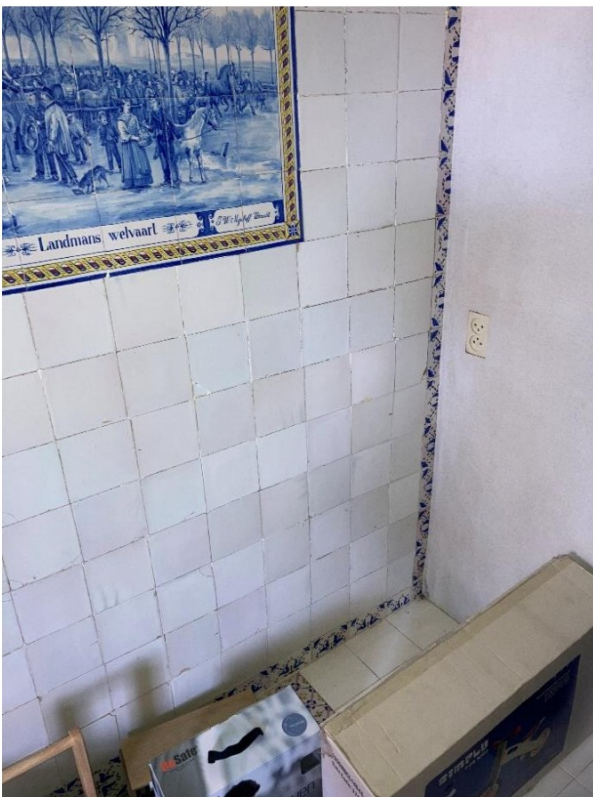
Fig. 42; linkerachterhoek woonkamer;