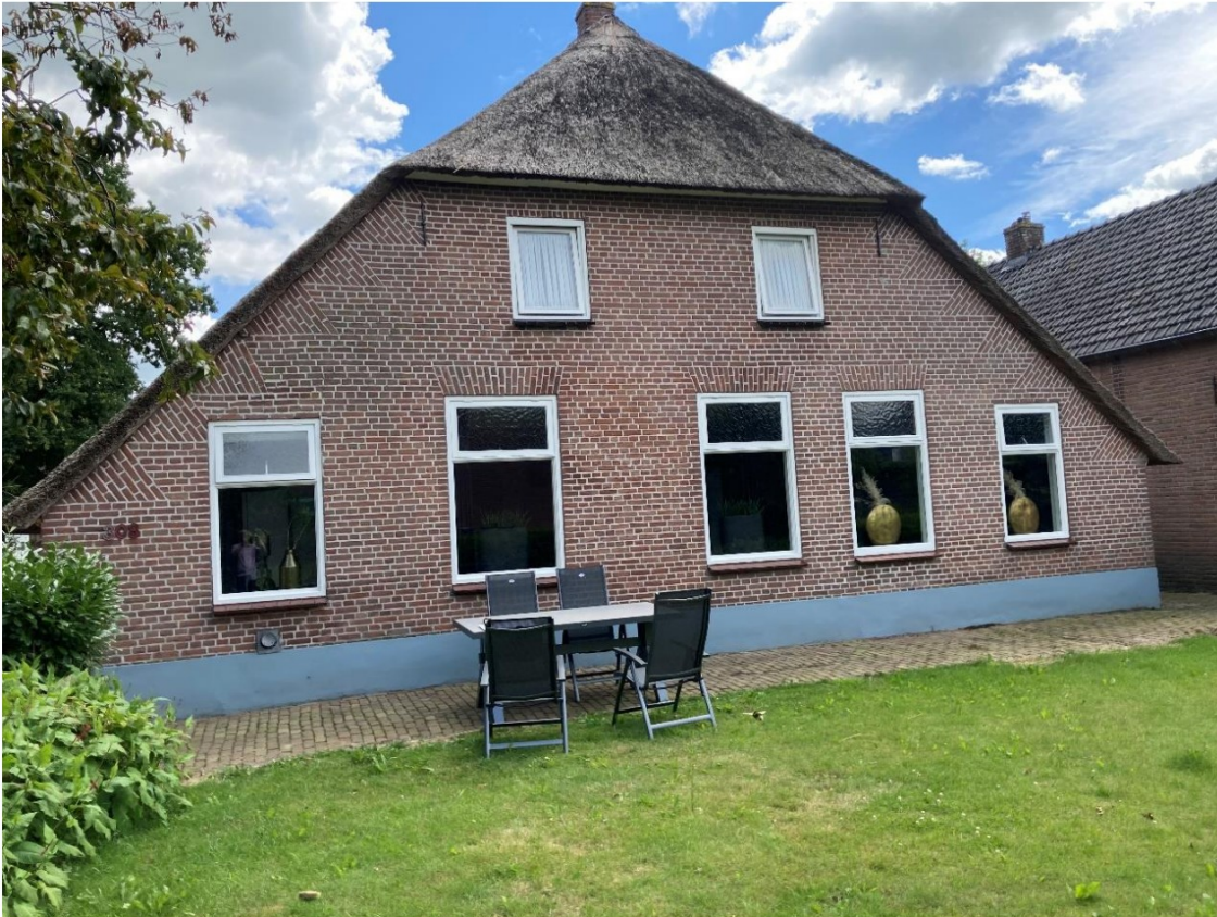
Fig. 47; voorgevel

Het voegwerk is wel een keer gerenoveerd, maar niet met snijvoegen. Op de randen van de kozijnen zijn diverse beschadigingen van het mw. te zien.