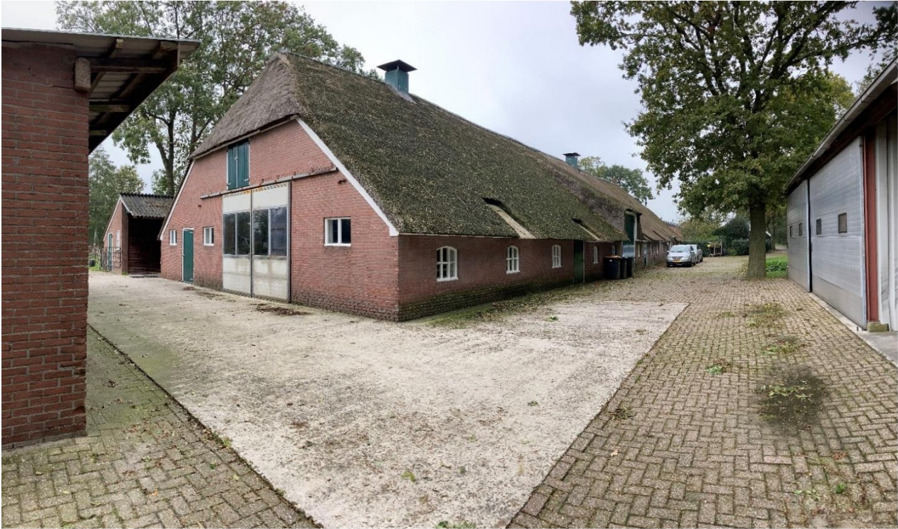
Fig. 20; Gewijzigd achterzijde boerderij met eromheen bijgebouwen.