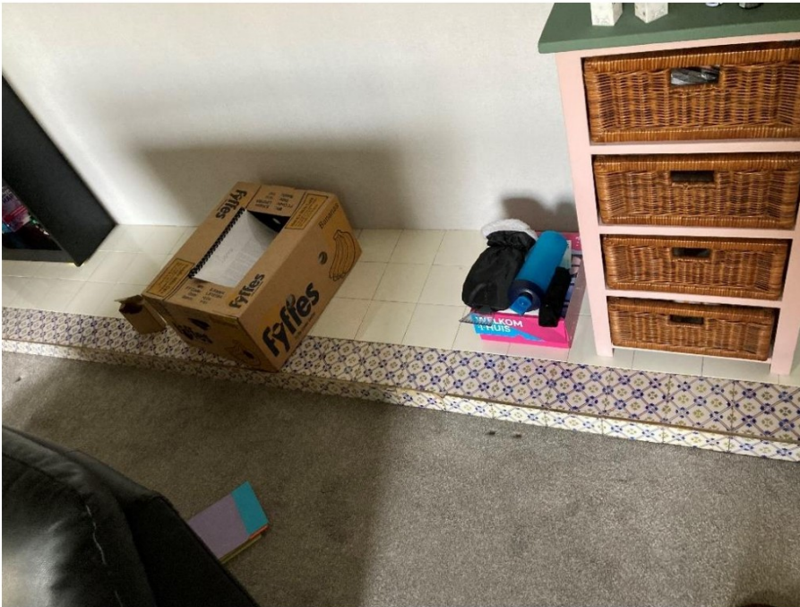
Fig. 41; kastenplint met nieuwe lijst.