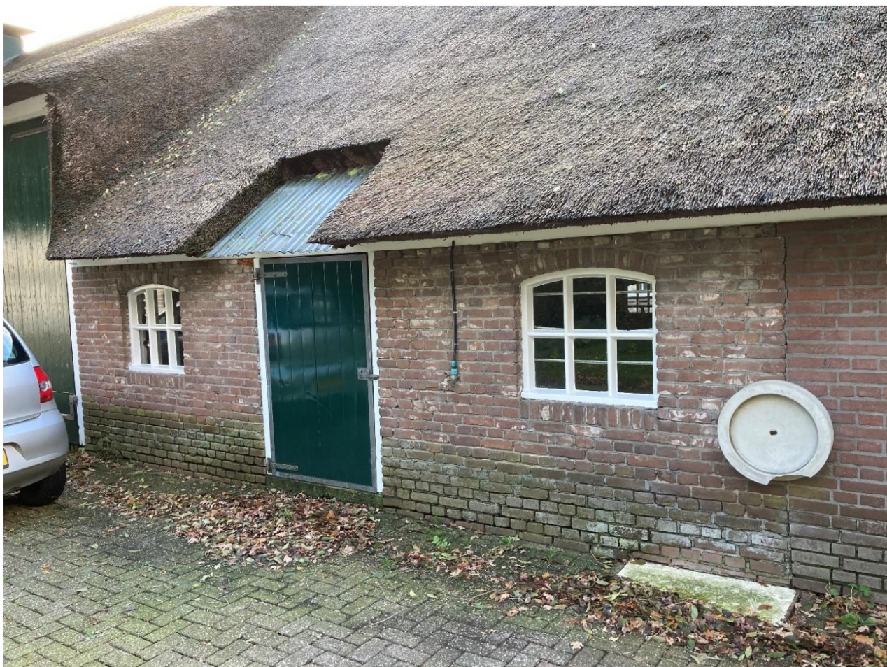
Fig. 51; achter 2 e stalraampje oud metselwerk