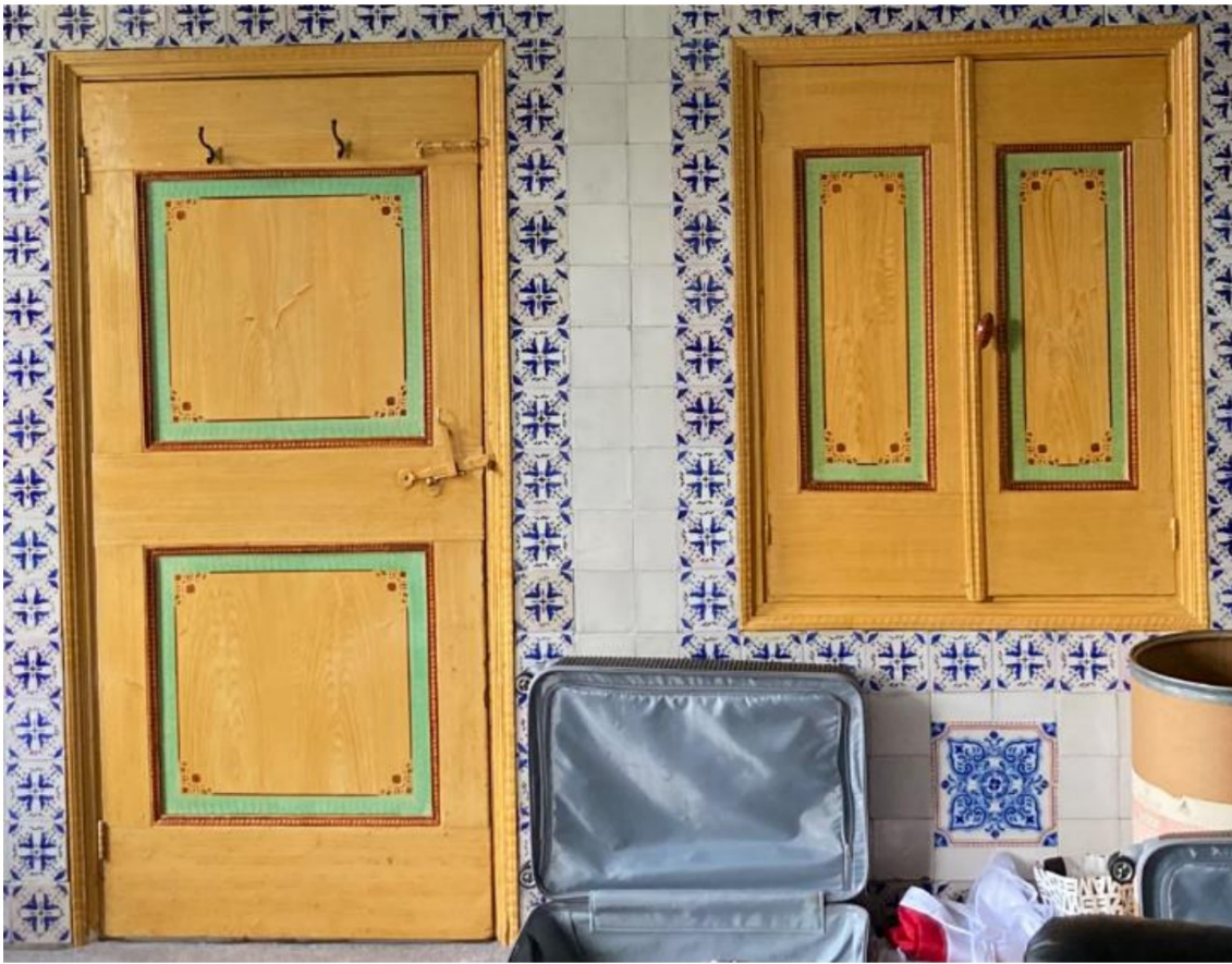
Fig. 45; Neuteboom op deur en luiken