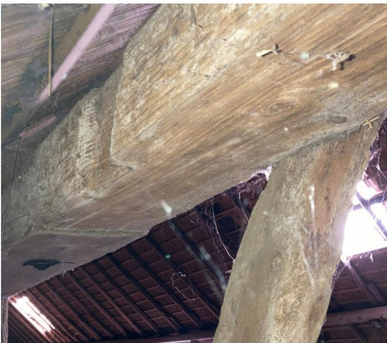
Fig. 32; schoren aan andere kant van dregholt; niet in keep.