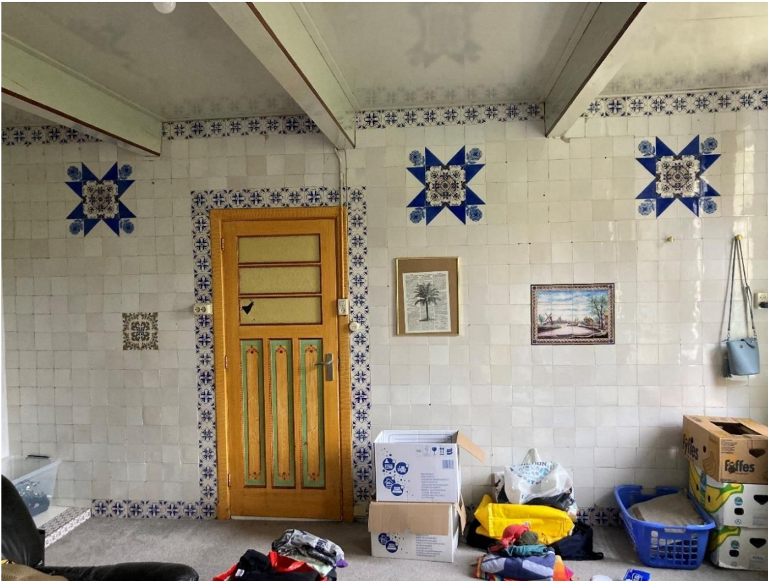
Fig. 37; Westelijke tussenwand.