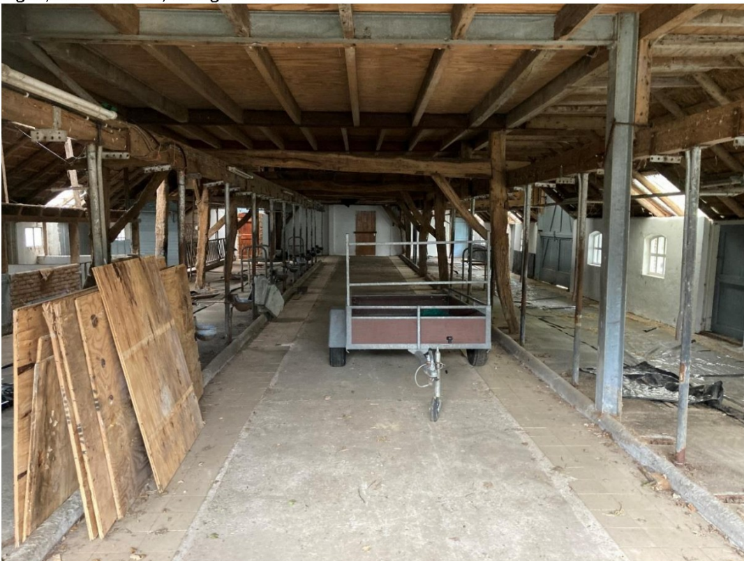
Fig. 7; Interieur stal: historische gebinten i.c.m. moderne stal met staalconstructie