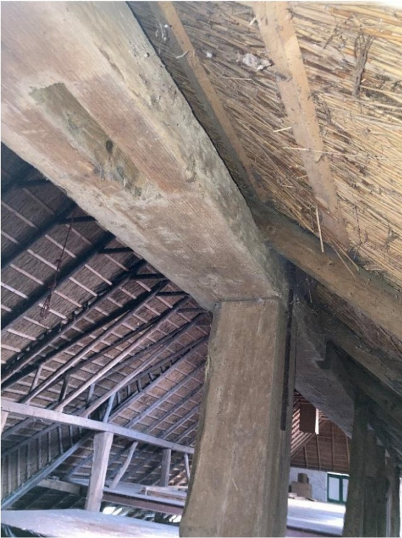
Fig.27; pen en gat gebintstijl; stijl verschoven; met staal vastgemaakt.