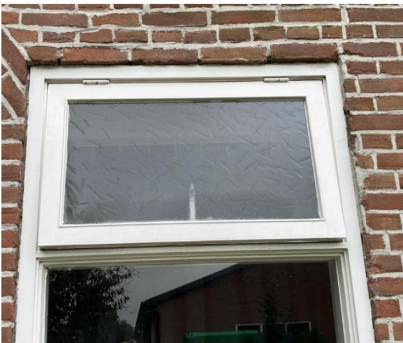
Fig.48; linker kozijn

Het voegwerk is wel een keer gerenoveerd, maar niet met snijvoegen. Op de randen van de kozijnen zijn diverse beschadigingen van het mw. te zien.