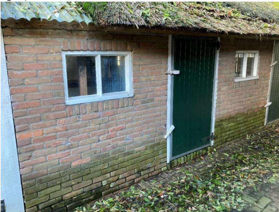
Fig. 57; Eerste stuk achter mestdeuren.