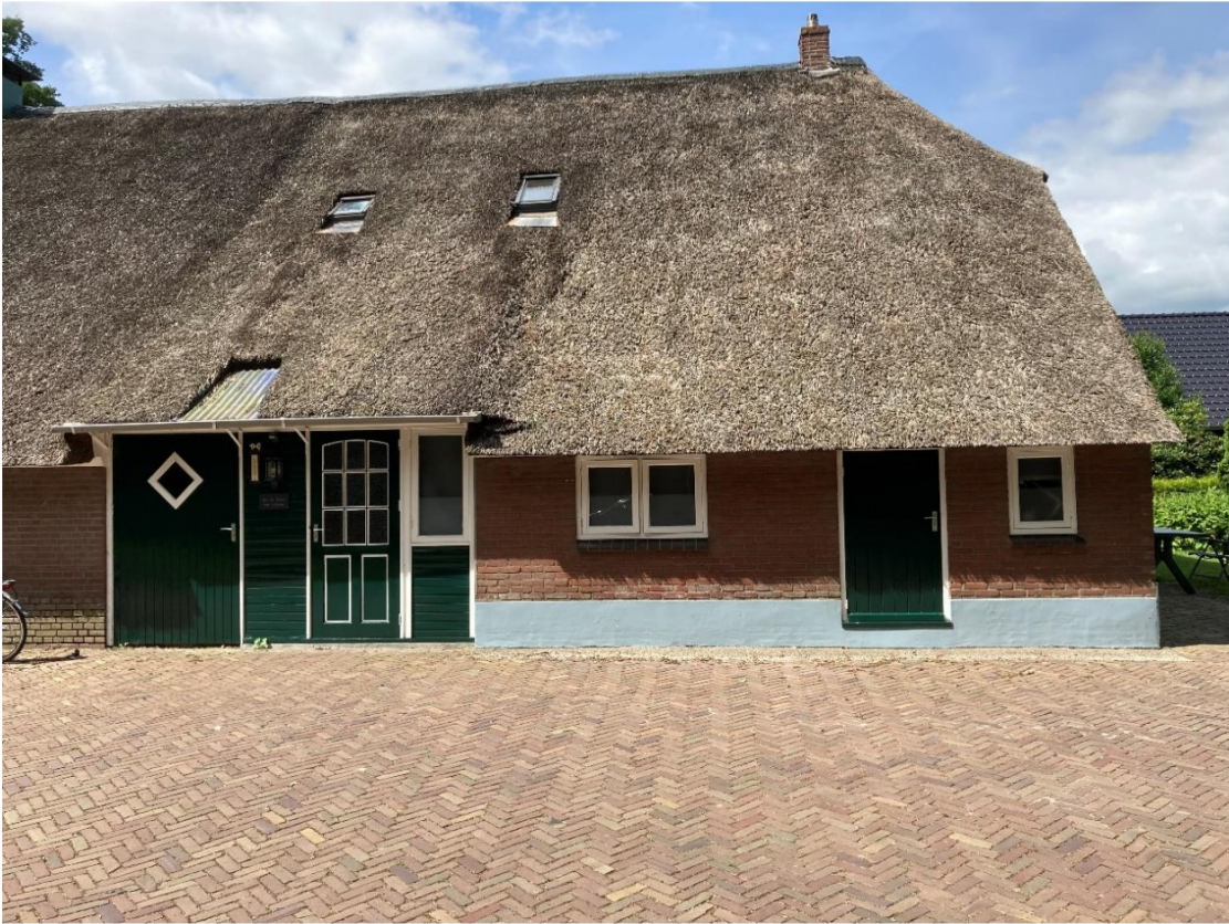
Fig. 50; zijgevel oost woonhuis