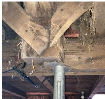
Fig. 34; detail afgezaagde gebintpoot op stalen kolom i.c.m. langsonderslag en naar voorzijde verplaatste schoren. Hier komen op 1 punt verschillende aspecten bij elkaar.