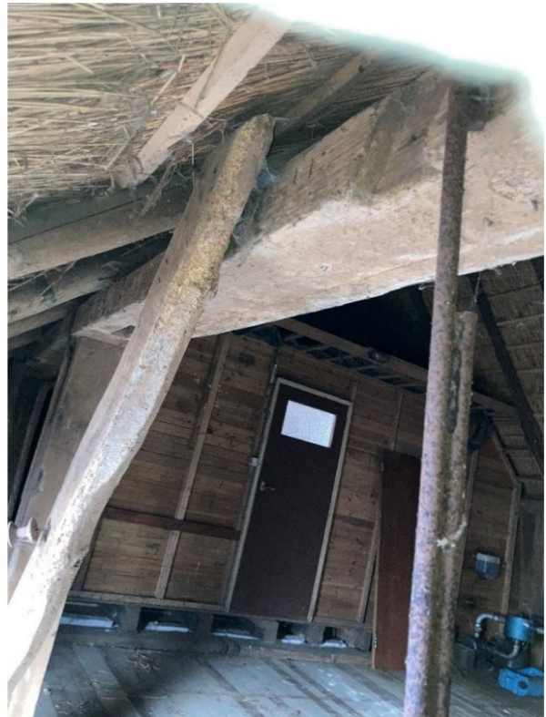
Fig. 28; schoor verschoven.; los -vast op dregholt; stijl verschoven en met staal verbonden.