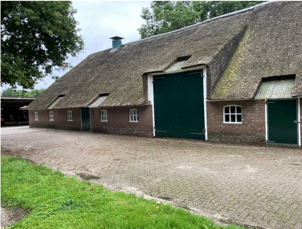
Fig. 52; Achter schuurdeur nieuw metselwerk.