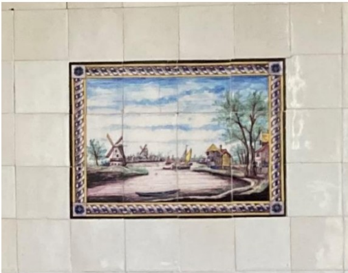
Fig. 39; afwijkend tableau; verschoven naad.