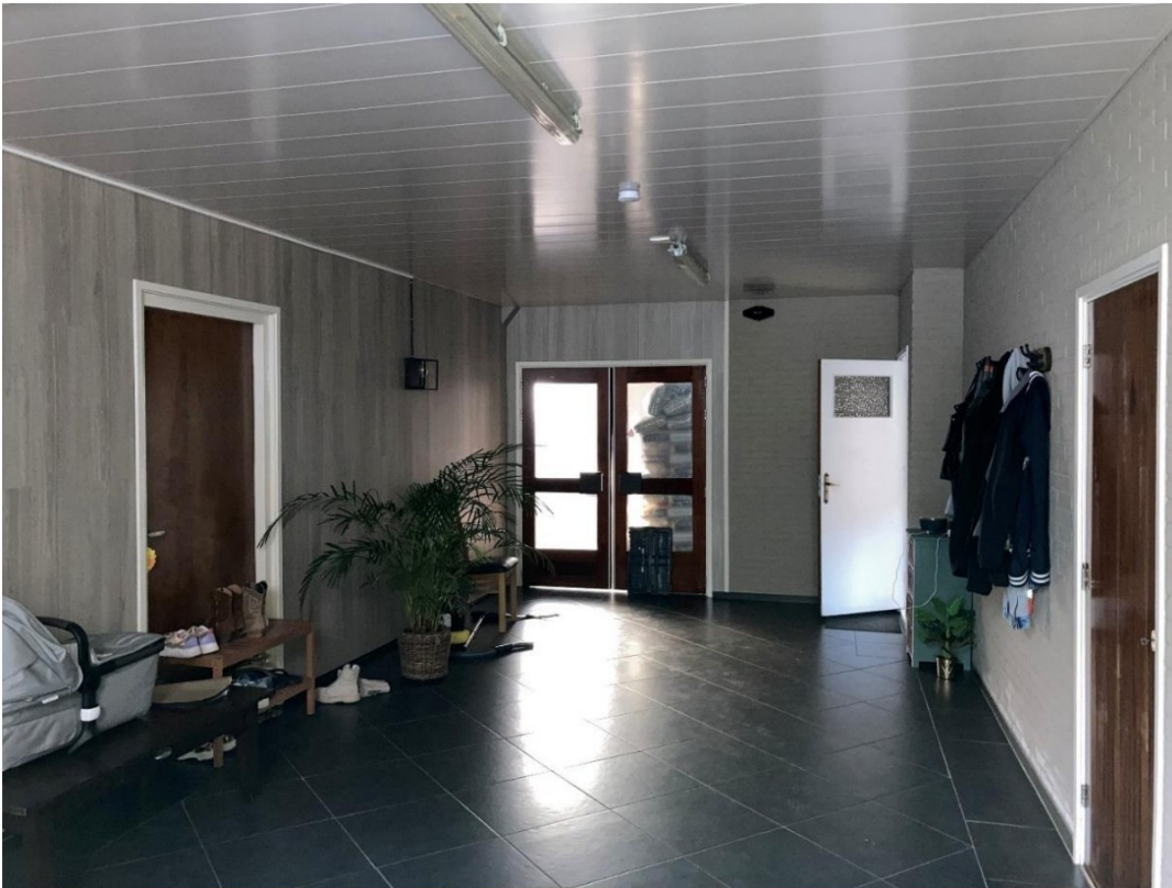
Fig. 6; overzicht hal; vroegere deel