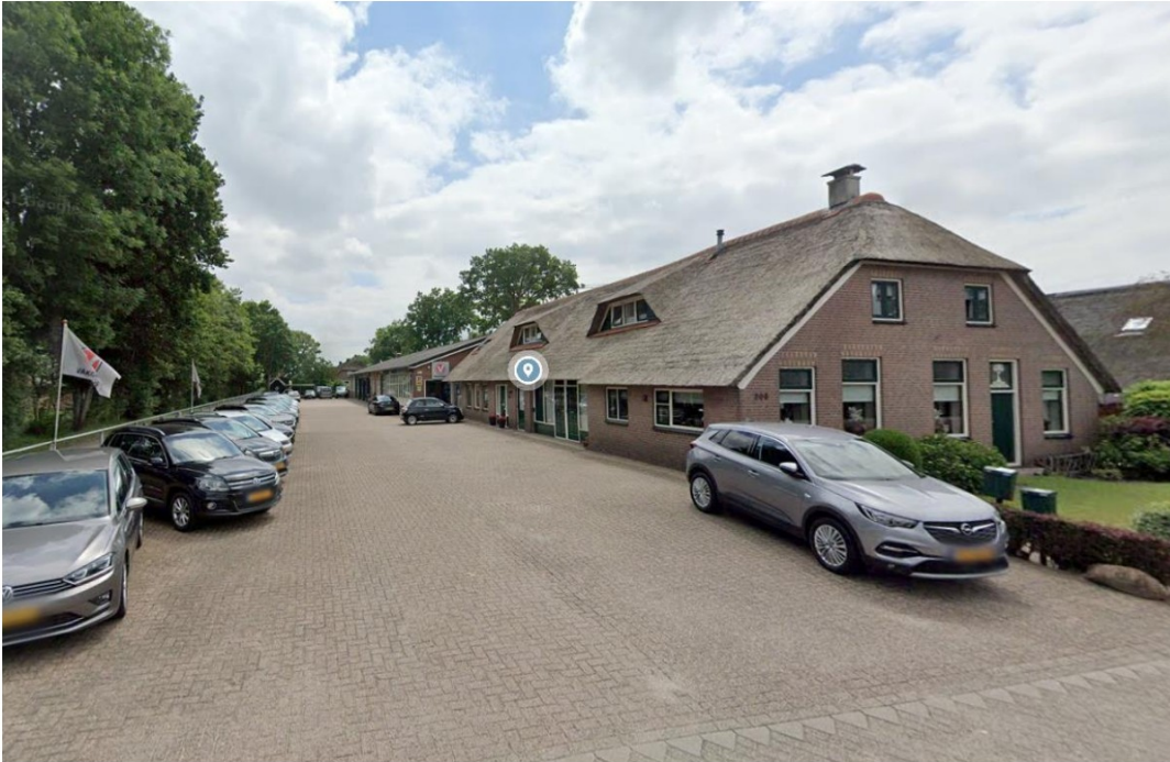
Fig. 8; locatie vanaf Gemeenteweg 306; autobedrijf