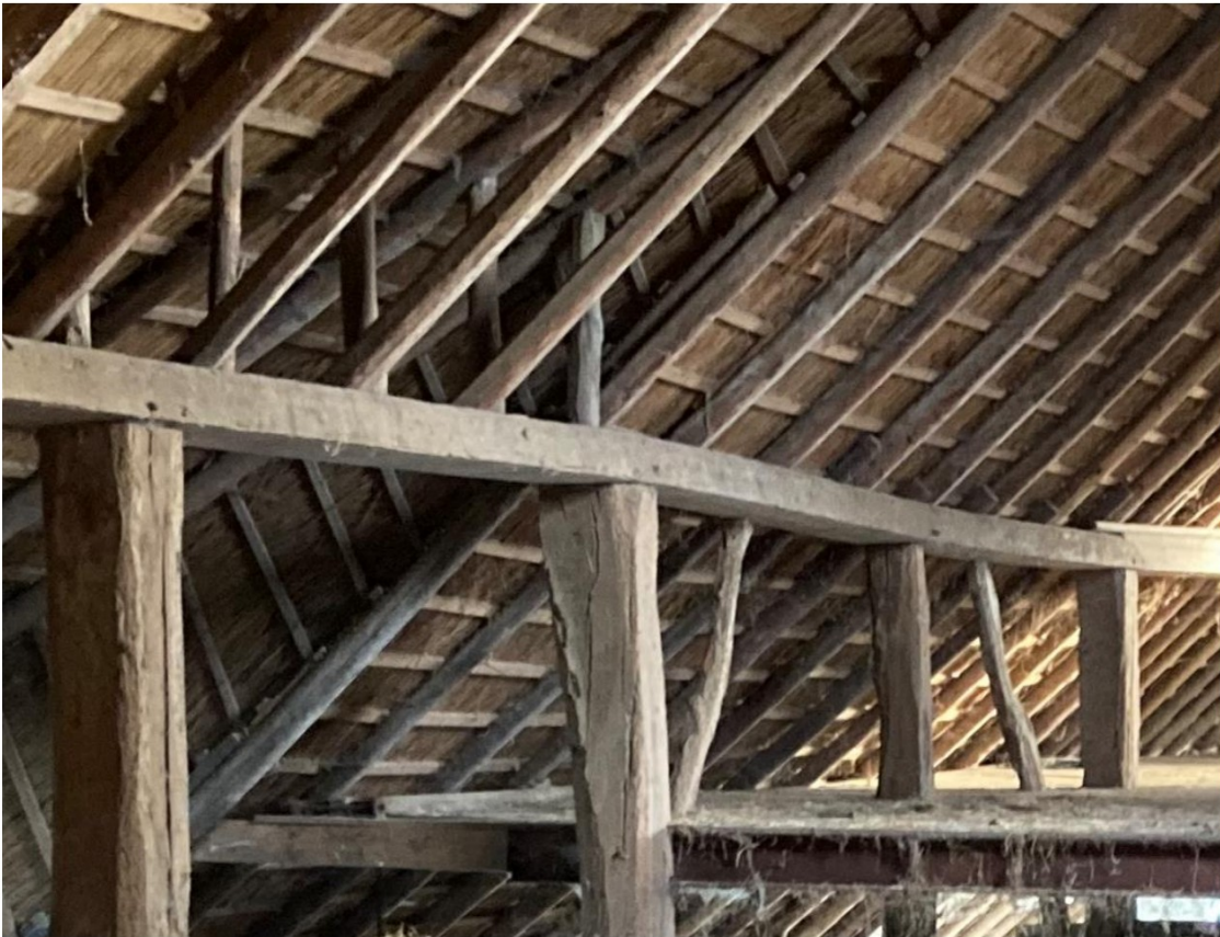
Fig. 26; gebint 4, 5 en 6 met extra tussenstijl