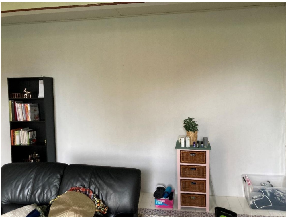
Fig. 5; Achterwand woonkamer