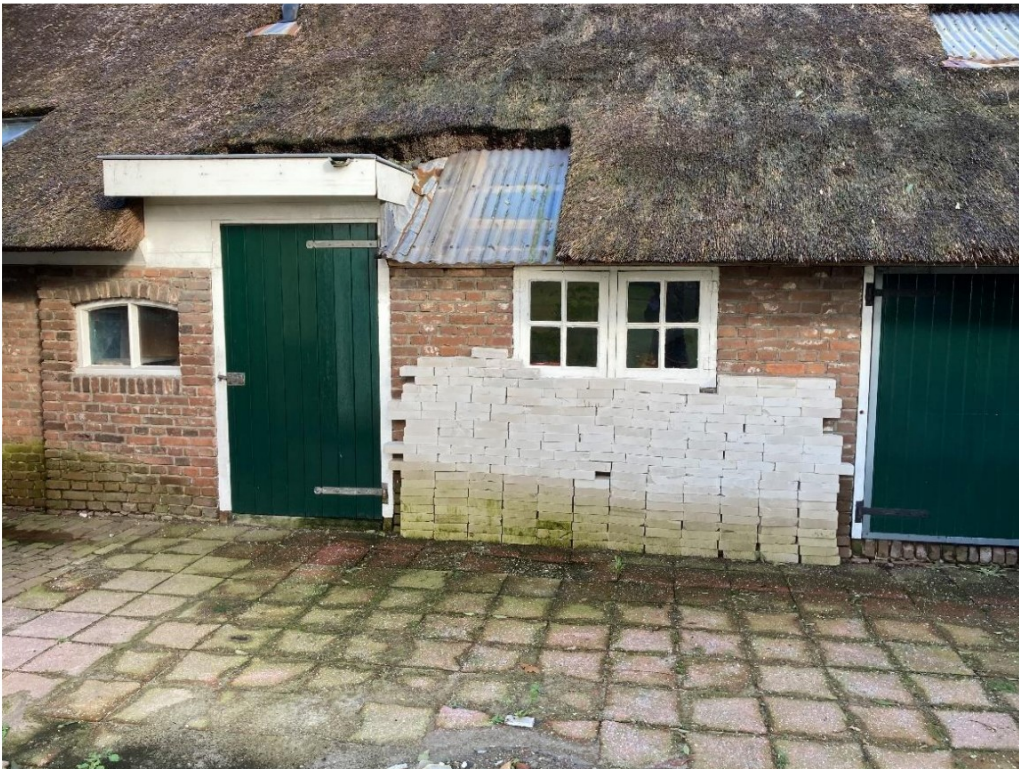
Fig. 55; tweede stuk westgevel rond zieldeur.