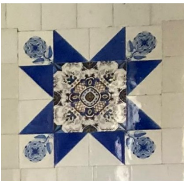
Fig. 40; Friese ster tussenwand