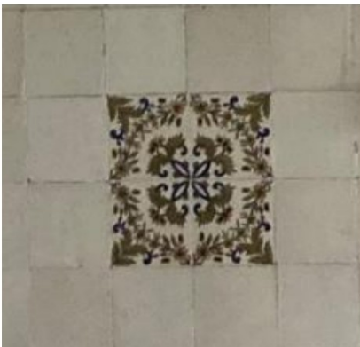
Fig. 38; afwijkende ster.