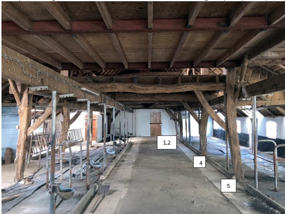
Fig. 23; gebintwerk naar voren; merk 5,4,2,1