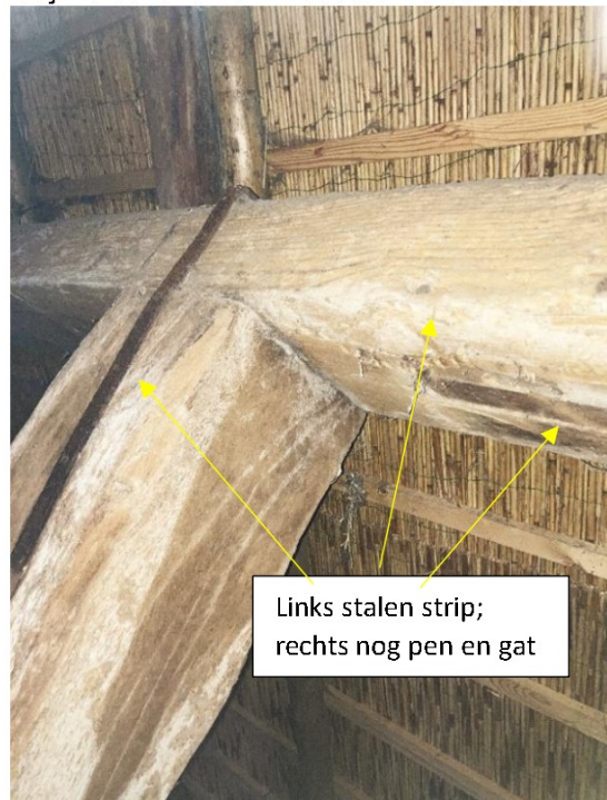
Fig. 30; Duidelijk zichtbare verplaatsing stijl

Links stalen strip; rechts nog pen en gat