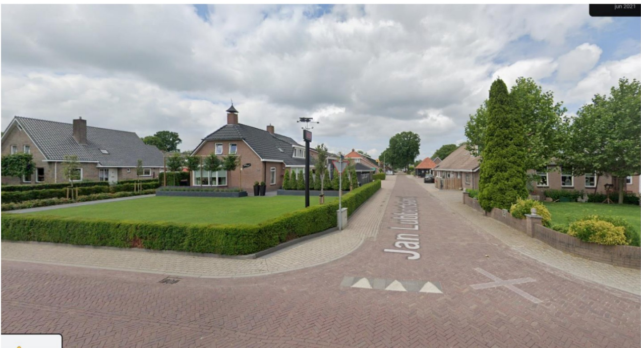
Fig. 9; overzijde van Gemeenteweg; Jan Lubbertsland