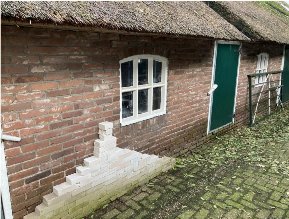
Fig. 56; 'derde' stuk metselwerk