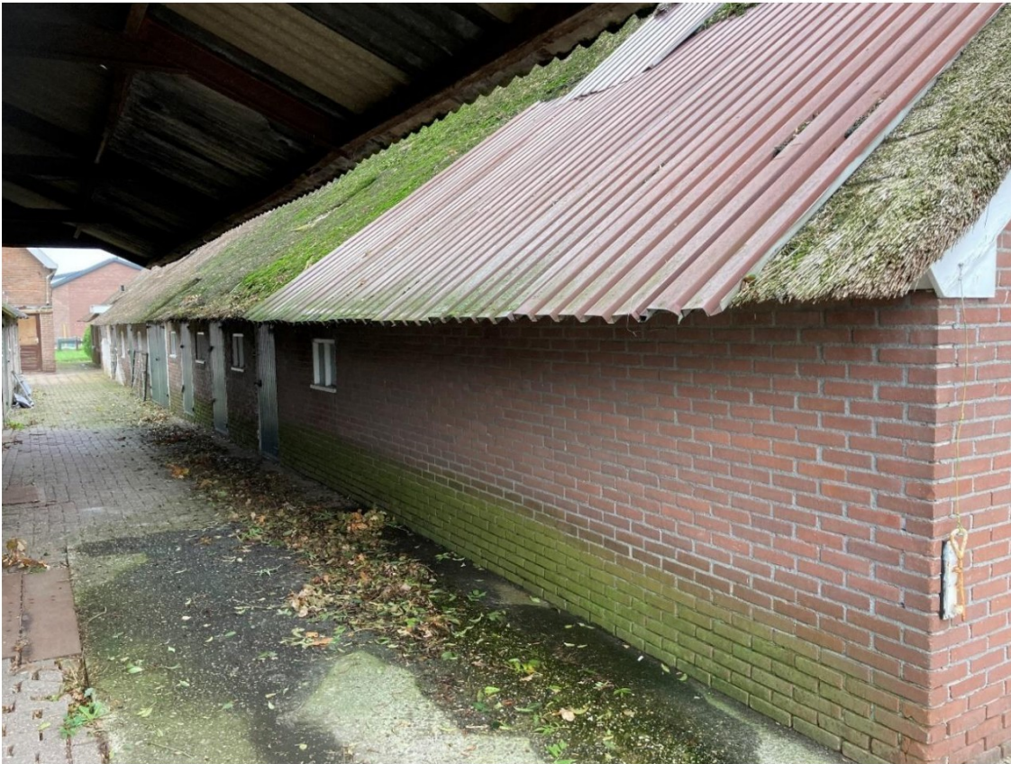
Fig. 57; laatste stuk gevelmetselwerk: