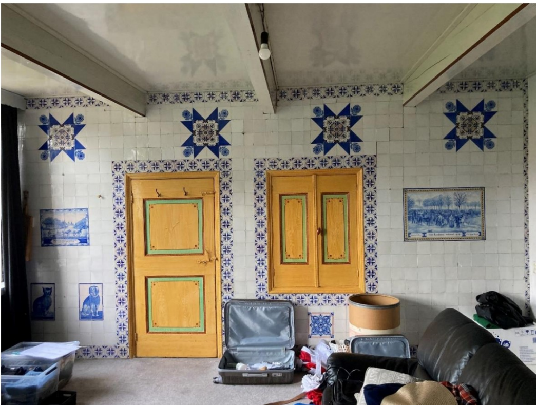
Fig. 36; Oostelijke tussenwand in authentieke