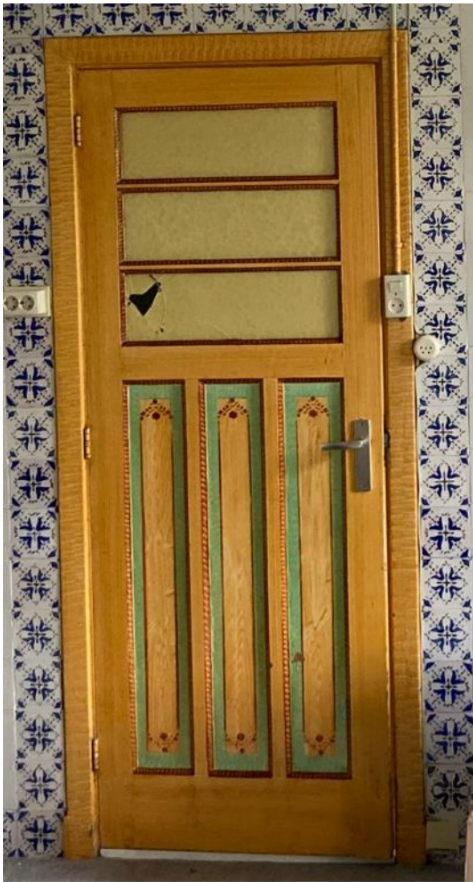
Fig. 46; Neuteboom op keukendeur