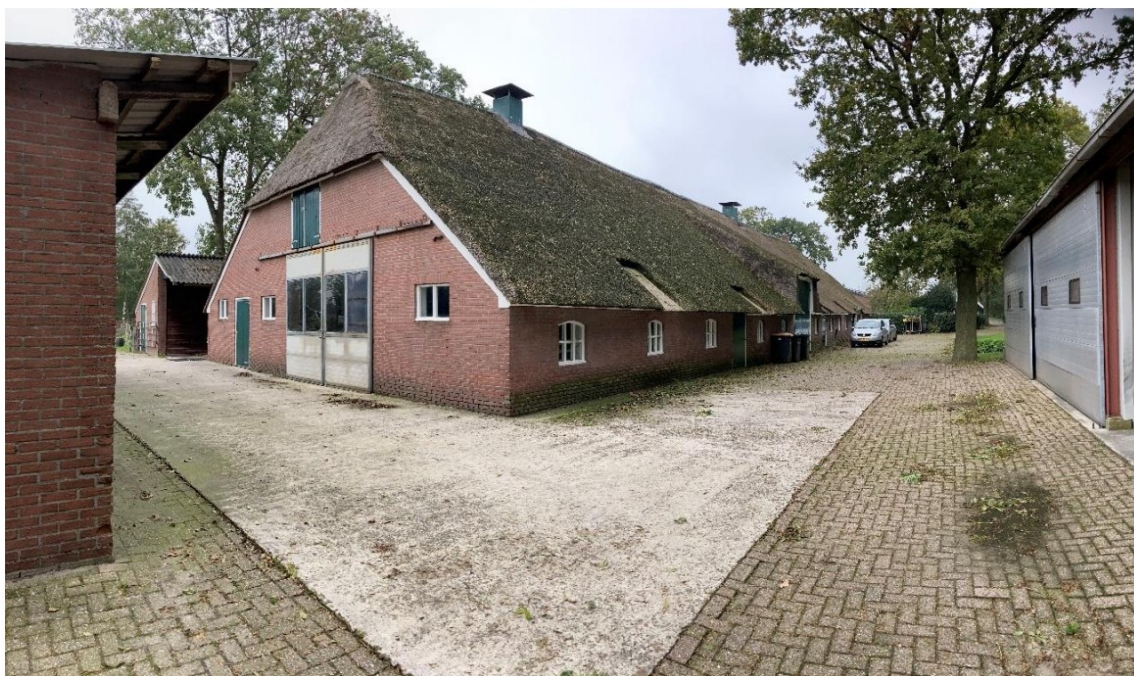
Fig. 3; achtergevel