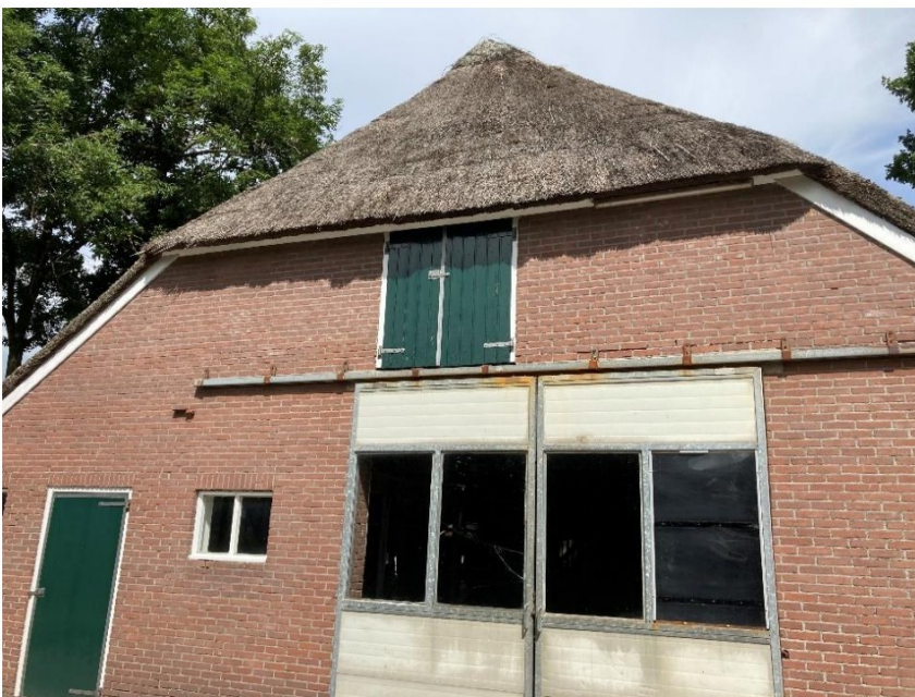
Fig. 53; detail foto achtergevel.