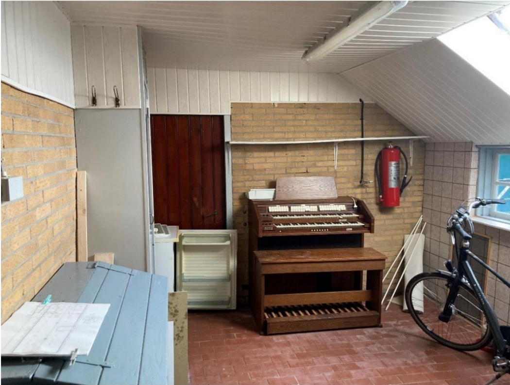
Fig. 35; 'pompstraat' of bijkeuken,