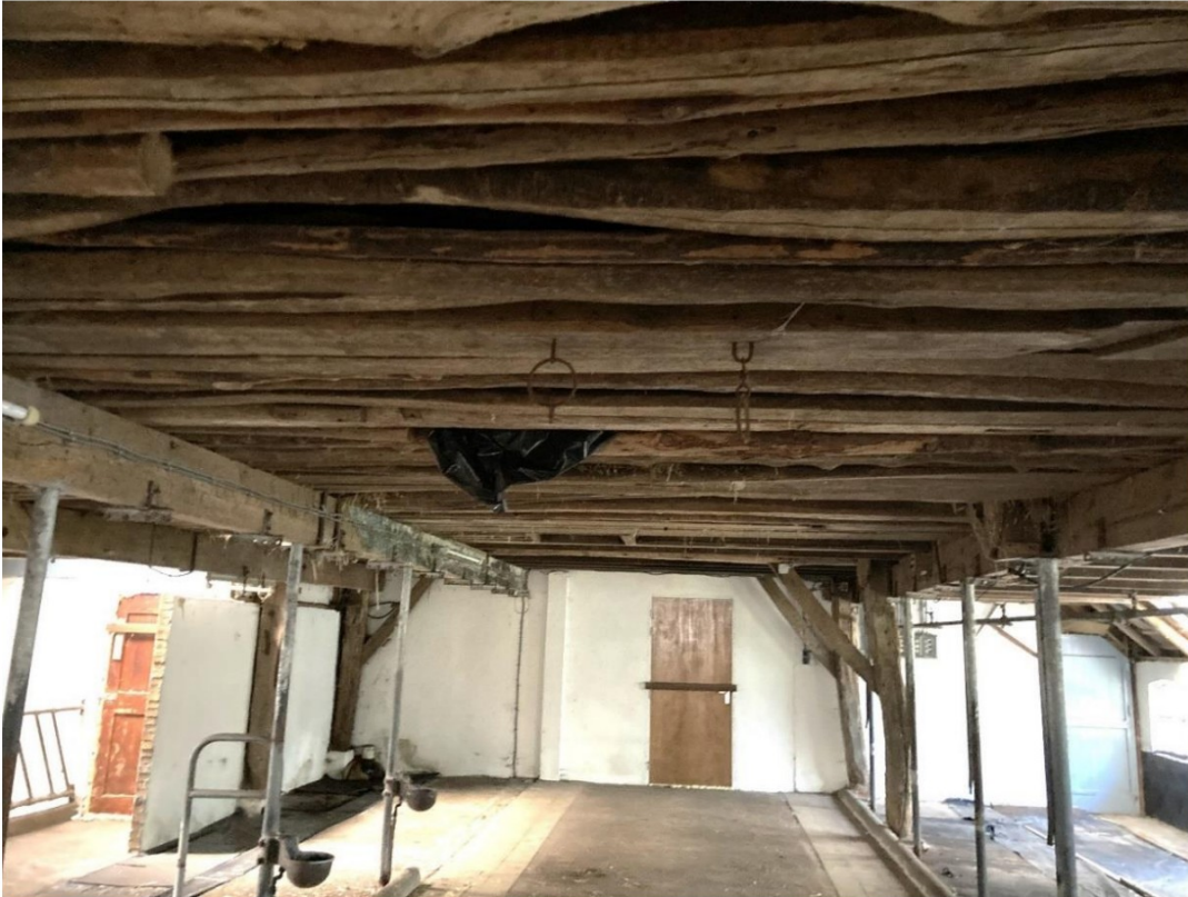
Fig.33; dwarsbalken over nieuwe langsonderslagen.

Op fig. 31 en 33 zijn ook de extra langs balken te zien op de stalen stalpoten, die voor de in dwarsrichting liggende zolderbalken (ipv. de langsrichting) de draagfunctie van de zolder hebben overgenomen van de ankerbalken van het gebint.