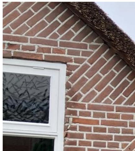
Fig. 49 Rechter kozijn