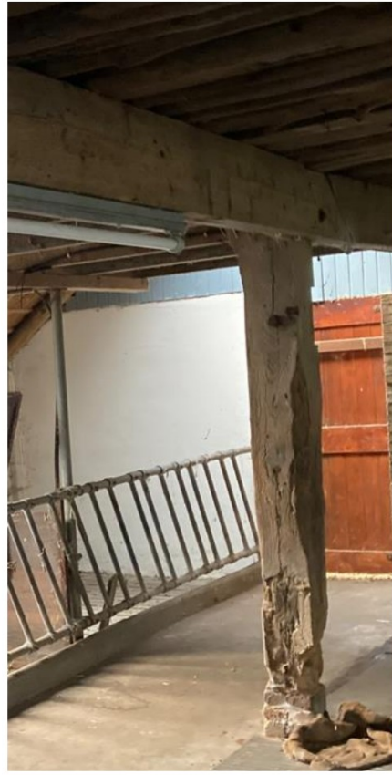
Fig. 24 en 25; Gebint met telmerk II en penverbinding. Aantasting te zien, ook bij gebintstijl nr.3