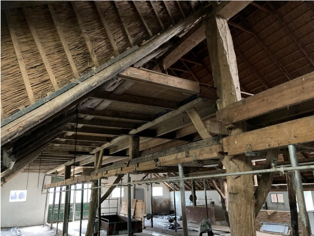
Fig. 31; Mix van gebintstellen, stalen liggers, kolommen, afgezaagde gebintstijl en nw. langs balk.