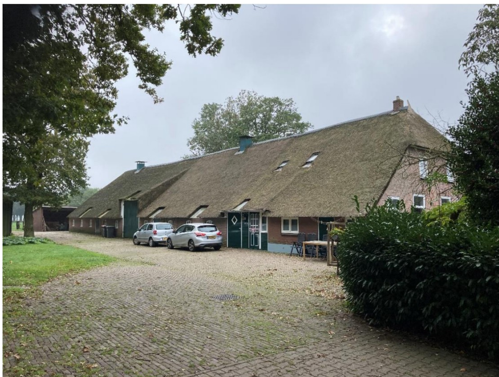
Fig. 2; voorgevel/ zijgevel