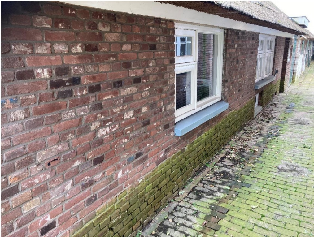
Fig. 54; eerste deel westgevel, gebikte stenen en nog verf van melkrek.