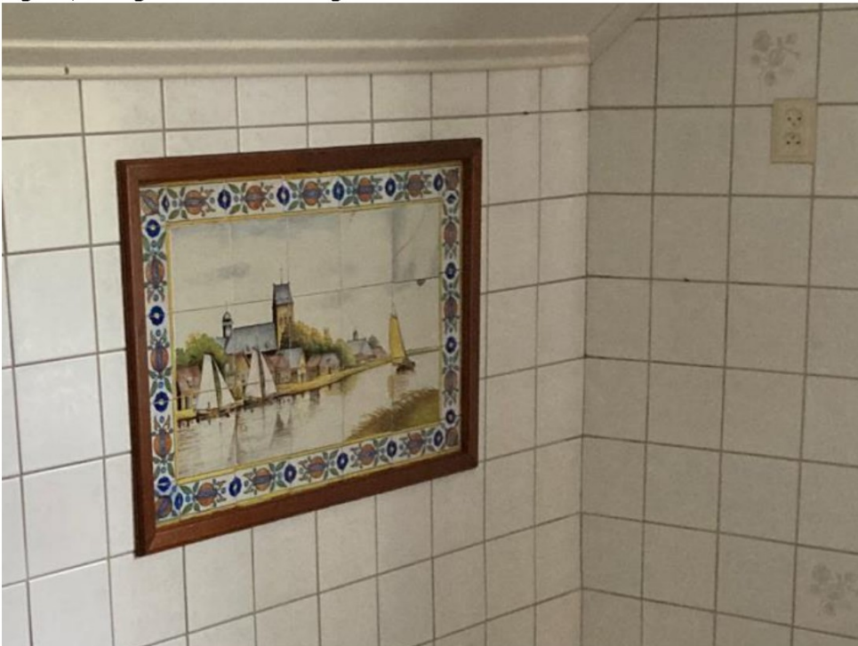
Fig.44; Linker voorgevel keuken: