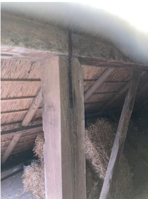
Fig. 29; nieuwe kolomstijl westzijde gebintstel 2, met koud opgelegde gebintplaat en stalen anker.