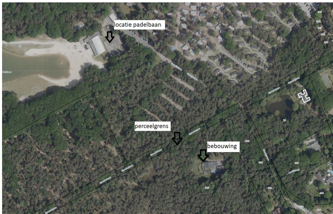
Kaart 3: kadastrale grenzen vanaf de padelbaan